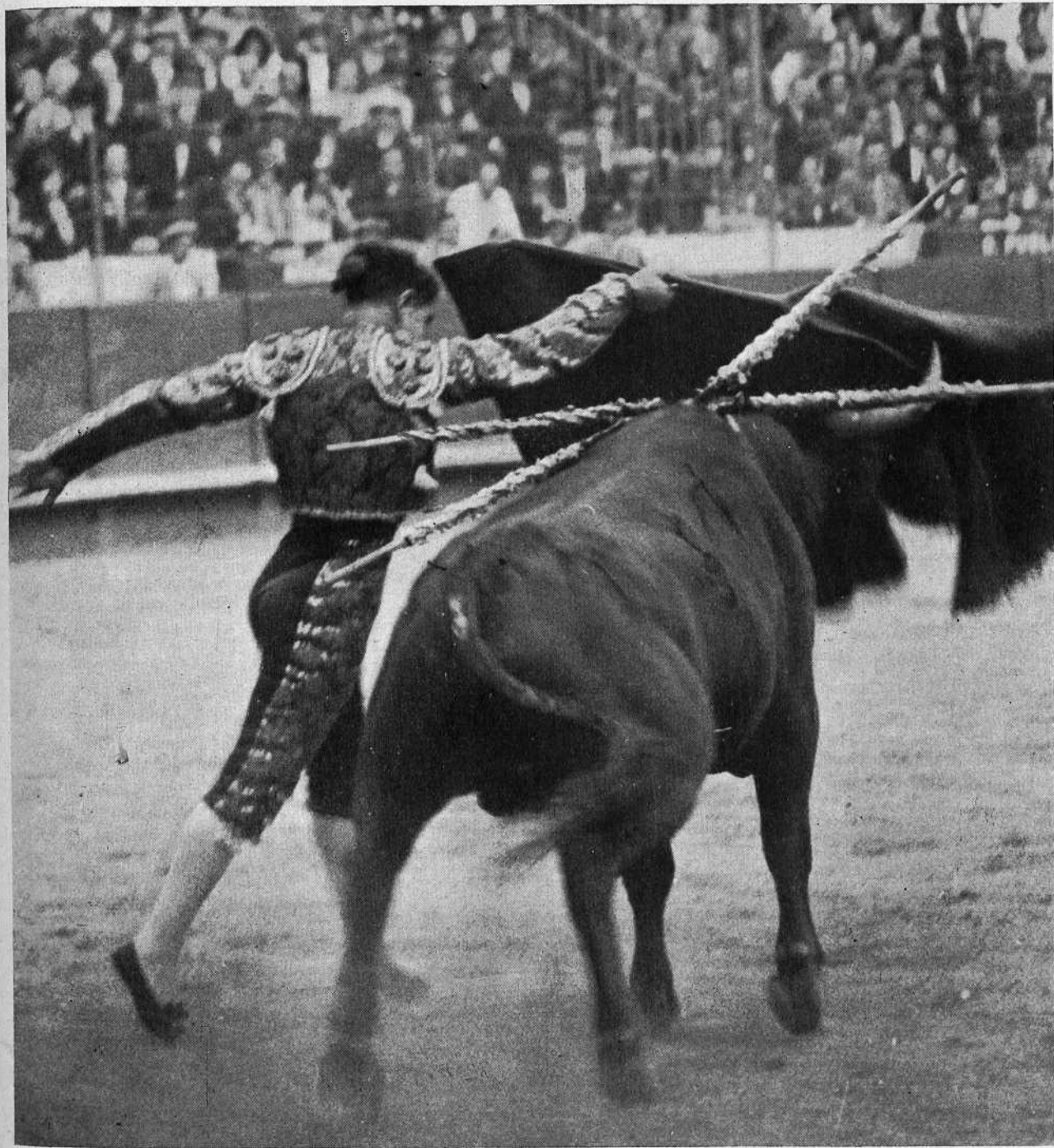
Un soberbio muletazo, en el que se patentiza la recia personalidad de este extraordinario lidiador, torero de casta y artista de temperamento. Primerísima figura del toreo por la divinísima gracia de su privilegiado estilo, en el que se funden la valentía y las más puras esencias del toreo sevillano