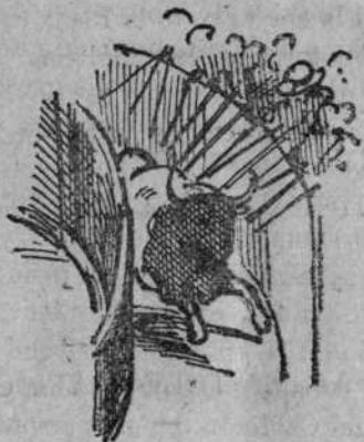
El toro, bueno en varas.