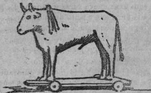
Un toro de piés.