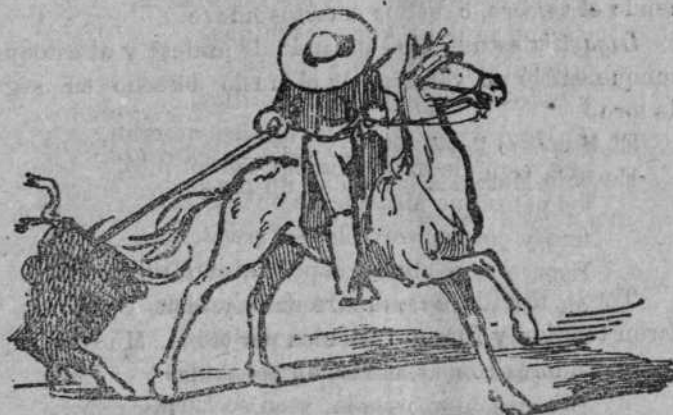
De frente por detrás.