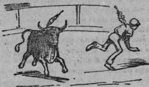
Un par... igual