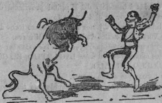
Alegrando al toro.