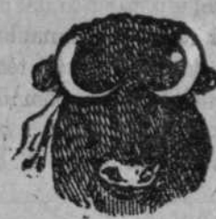
Algo brocho y una mijita caído.