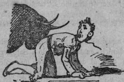
Atracarse de toro.