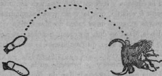
En corto y por derecho.