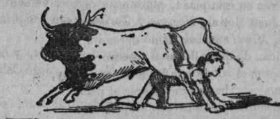
Saliendo por la cola.