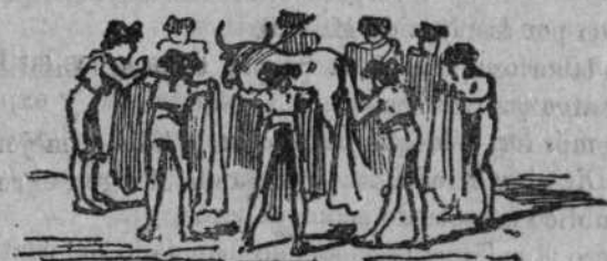
Solos y en los medios.