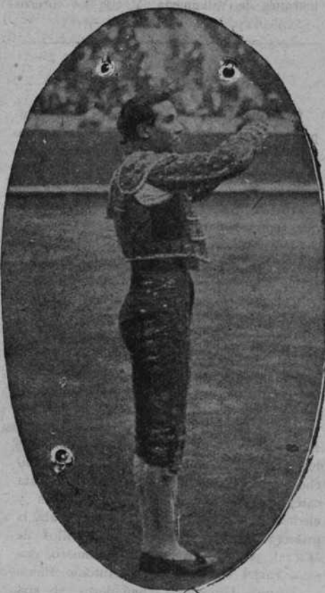
CARNICERITO DE MEXICO

ca un ¡ay! de angustia, porque los pitones del toro, repujan con su caricia, el bordado de la casaquilla del lidiador. Un par de banderillas, otro, otro, otro más. Unos son de frente en los medios; otros en las tablas, por dentro, en ese terreno inverosímil en el que únicamente este torero logra banderillar. Y en todos, la reunión es impresionante, brutal. El toro llega hasta meter la cabeza en la faja del torero y éste, se apoya en la punta de los pies y en los palos que clava juntos en lo alto del