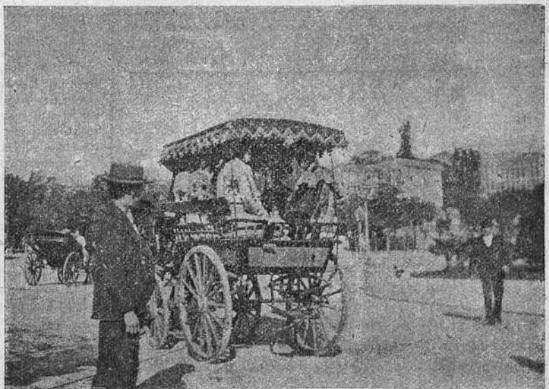
Mazzantini y su cuadrilla camino de la Plaza.

La corrida que estaba en proyecto á beneficio del matador de toros Juan Ruiz Lagartija , por fin ya es un hecho, al decir de algunos apreciables colegas, y tendrá lugar en la Plaza de esta corte el 14 del próximo mes de Noviembre.