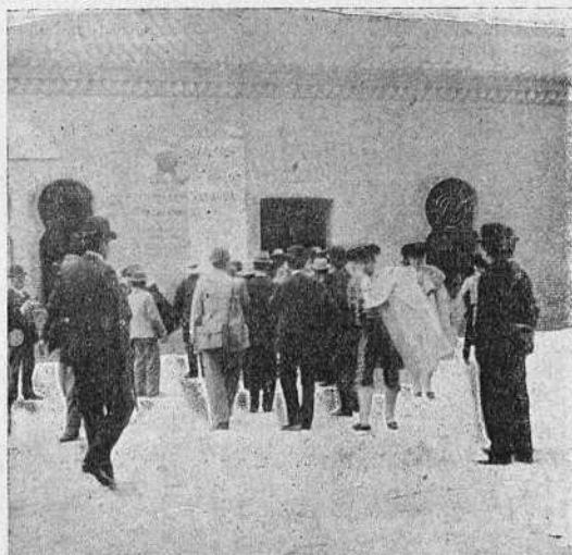
Preparándose para salir los toreros.—Después de la visita á la capilla.—(Instantánea de M. Ríos.)