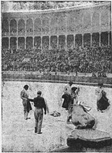
Puntillero en funciones.