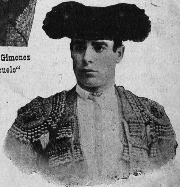
Rafael Molina "Lagartijo"