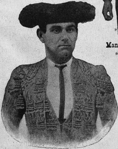
Diego Rodas "Morenito de Algeciras"