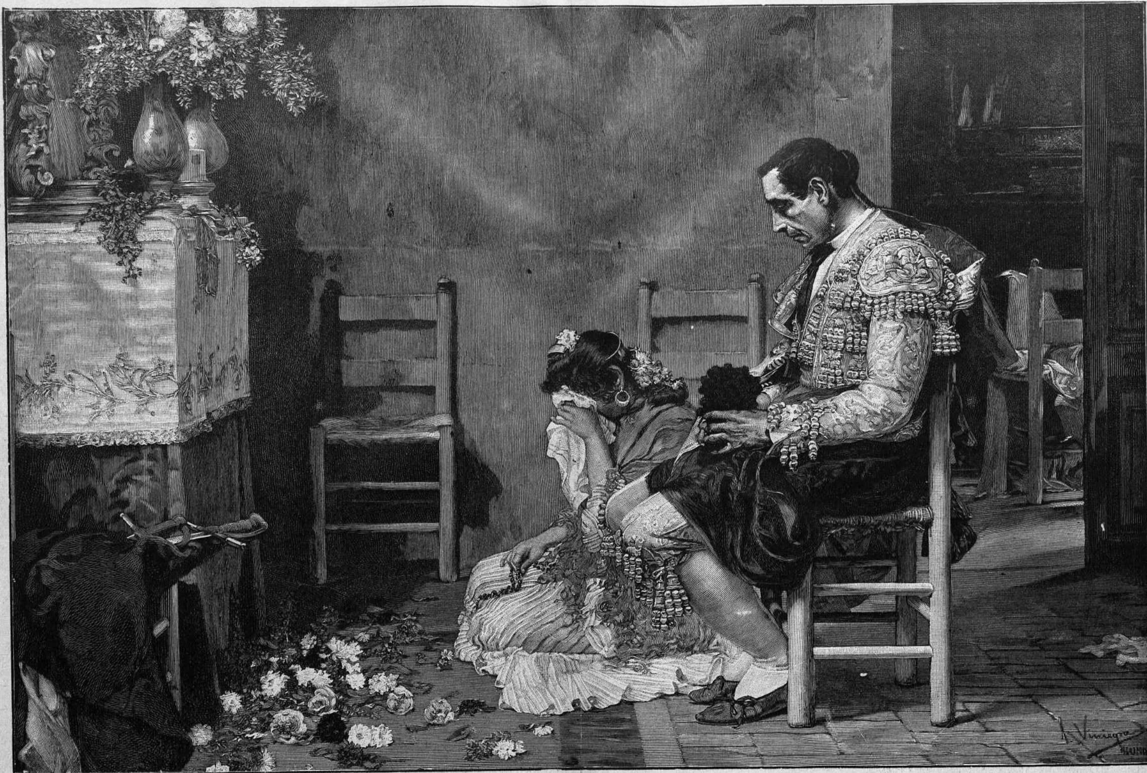
ANTES DE LA CORRIDA, cuadro de J. Viniegra