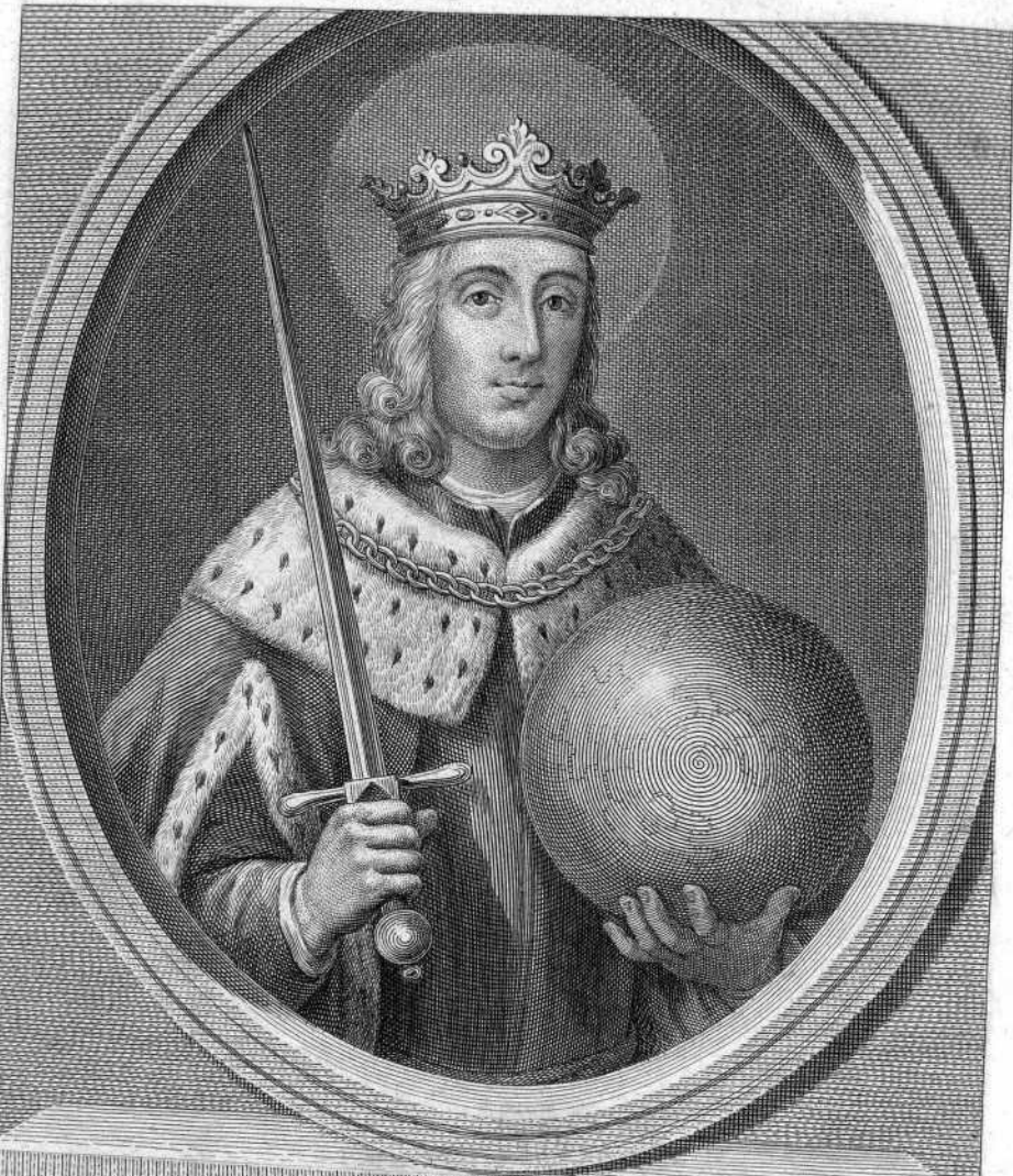
SANCTUS FERDINANDUS tertius Castellę et Legionis Rex.