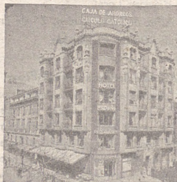
SUCURSAL - Espolón, 32 (ENTRADA POR EL HONDILLO)