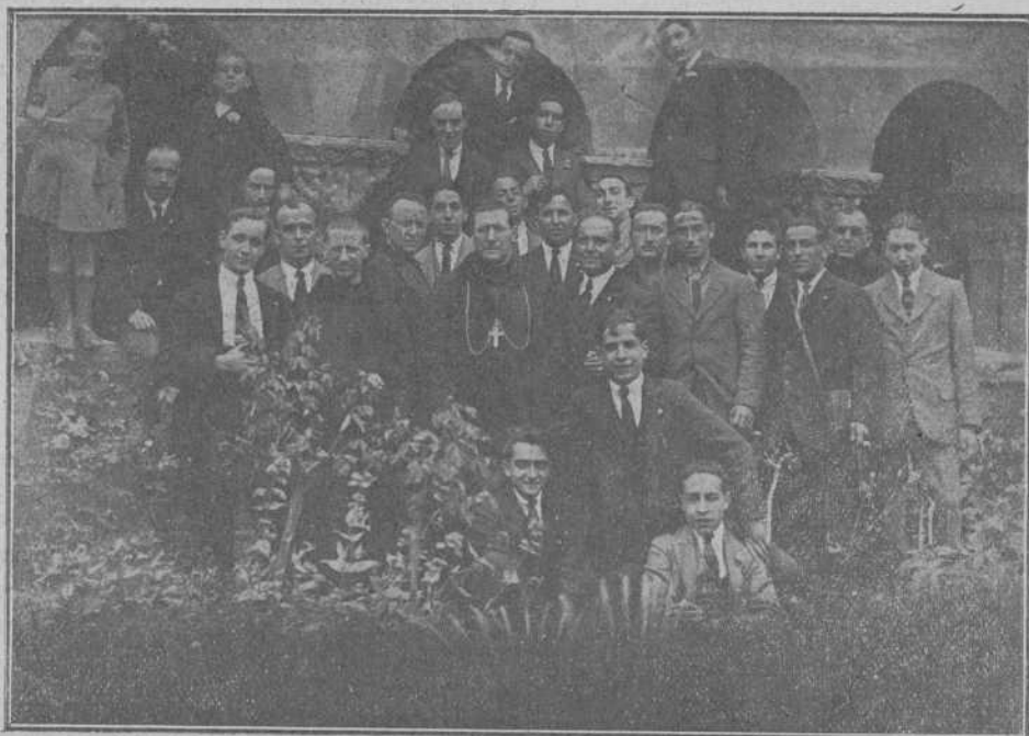
Los excursionistas del Cuadro Dramático, con el Rvmo. Abad Mitrado de Santo Domingo de Silos junto al célebre Claustro de aquel histórico Monasterio.

Acabáramos. La carretera, describiendo líneas que-