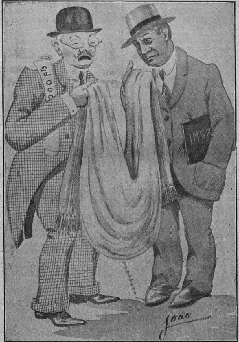
A Mosquera y á su mozo —les ha llenado de gozo— el triunfo de Echevarría. — Si no, mirad su retozo... ¡Cómo lloran de alegría!

Permita Dios, y te veas, como se vió... Manolete en el puente de Alcolea.