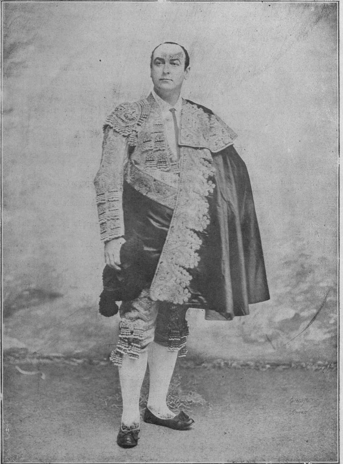
LUIS MAZZANTINI Y EGUÍA