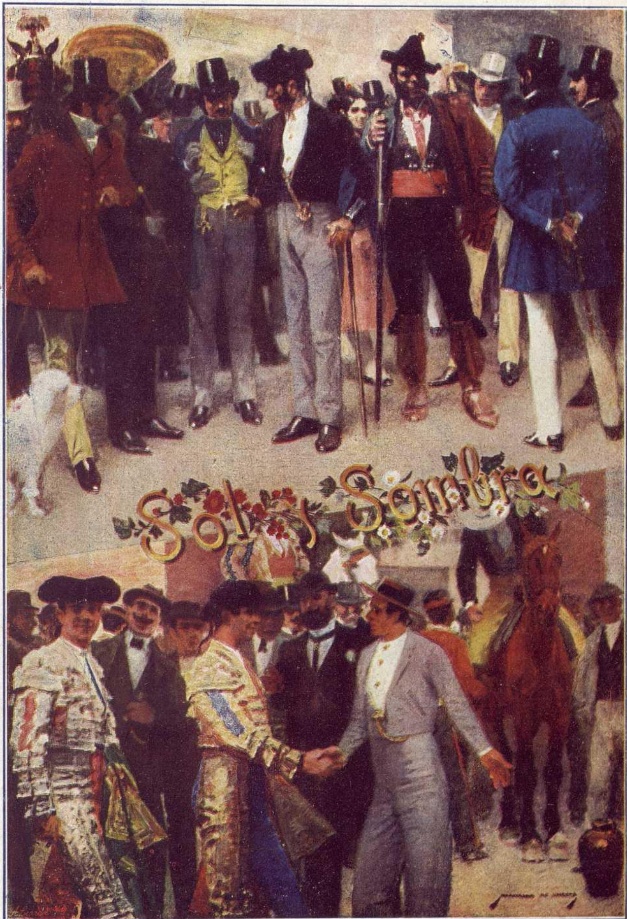
INAUGURACIÓN DE LA TEMPORADA.—ANTAÑO Y OGAÑO POR MARCELINO DE UNCETA