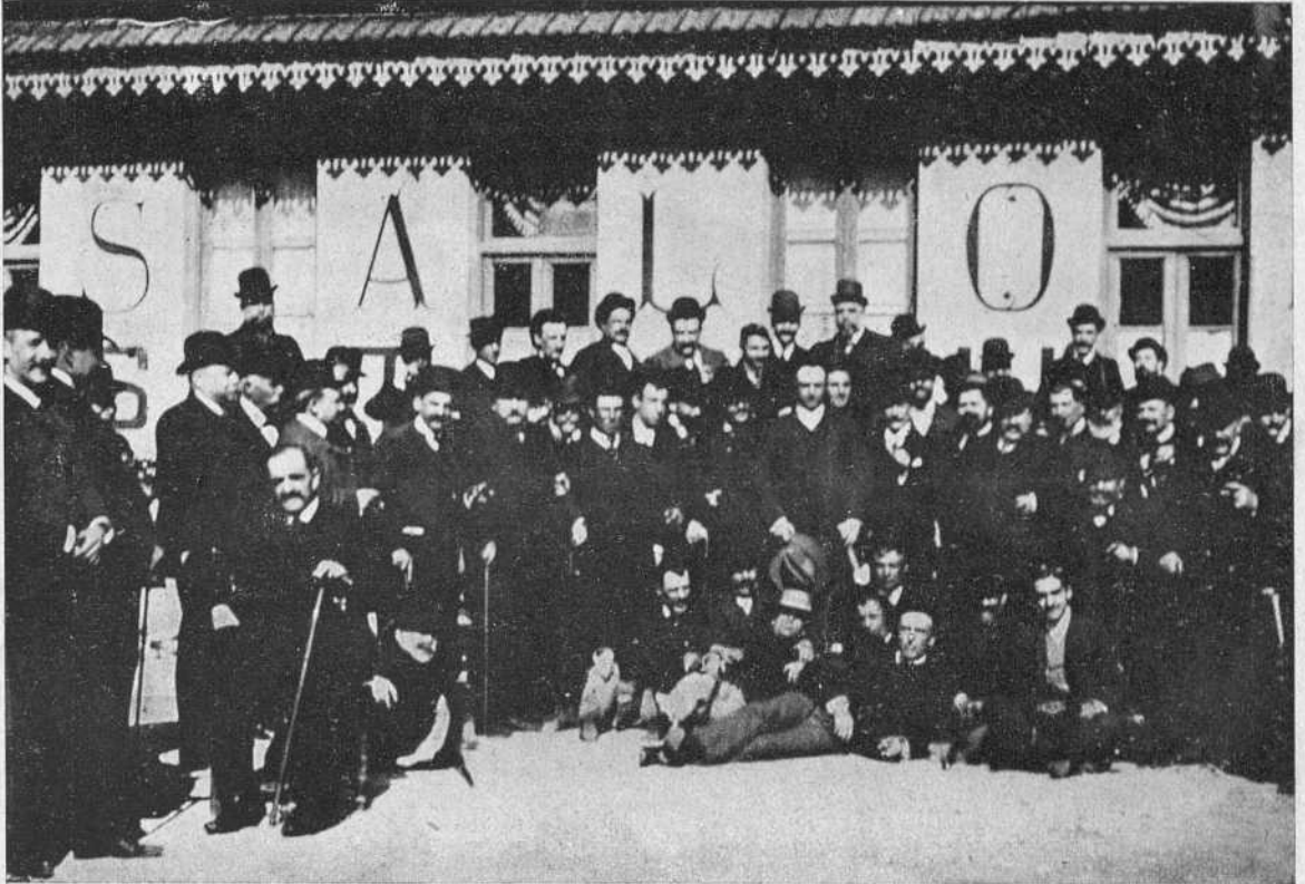
LUIS MAZZANTINI Y GRUPO DE COMENSALES

Como preliminar de temporada, merece plácemes la idea de esa reunión casi familiar, á la que asistieron cuantos aprecian á Luis, por las exquisitas prendas de carácter, cultura y educación, que tanto le distinguen, para manifestarle profundo afecto y cordial simpatía á la hora de reanudar en el coso madrileño la penosa lucha á que su arriesgada profesión le impone.