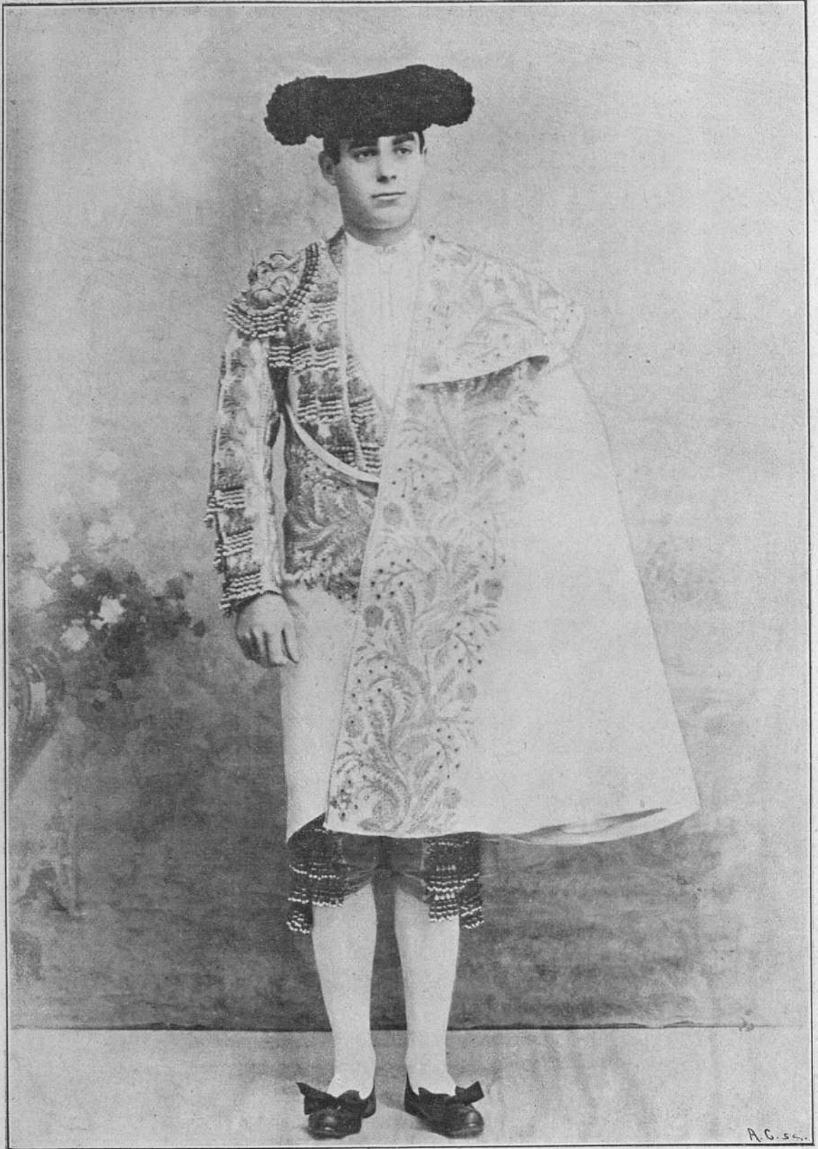
RAFAEL MOLINA ( Lagartijo chico )