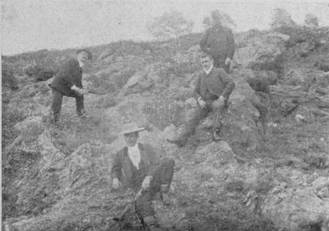
UN DESCANSO EN LA SIERRA

Ya lo dijo Buffon: el estilo es el hombre. Y yo, con menos autoridad que él, añado: ¡desdichado de aquel que se com-