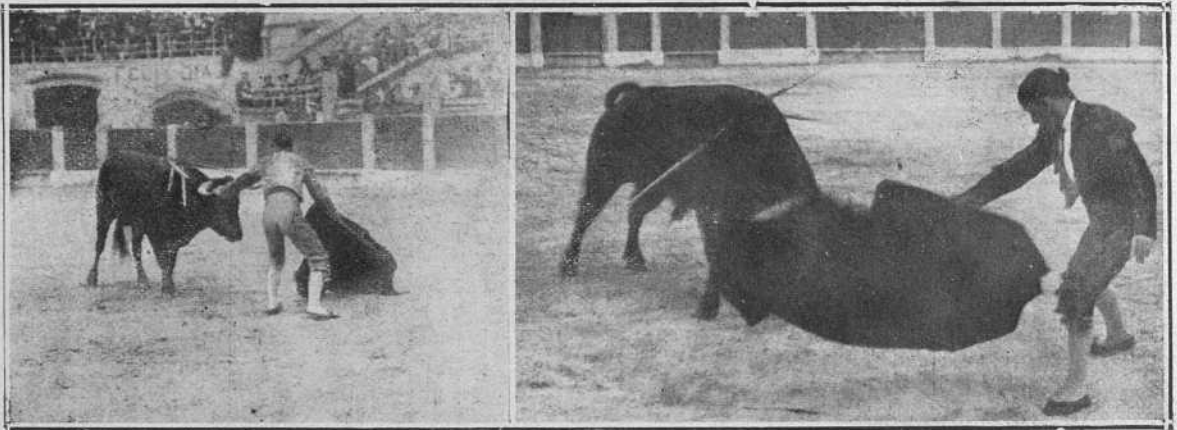
Oviedo.—Posada en un adorno.—Terremoto preparando un molinete.

Casielles.—Ni que decir tiene que la gente fué á la plaza ávida de presenciar el emocionante toreo de este muchacho, pero... el maldito pero; yo creo que el no lucirlo en todo su esplendor no fué su culpa, sino de