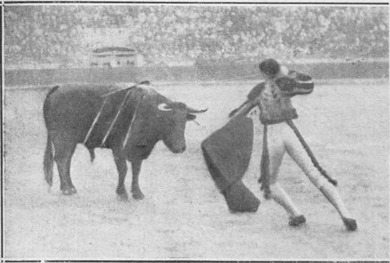
Valencia, 18 de Octubre.—Joselito matando uno de los seis de Contreras.

recía un general en jefe, á fuerza de dar órdenes á todo el mundo. ¿Calderón...? ¡en pañales!