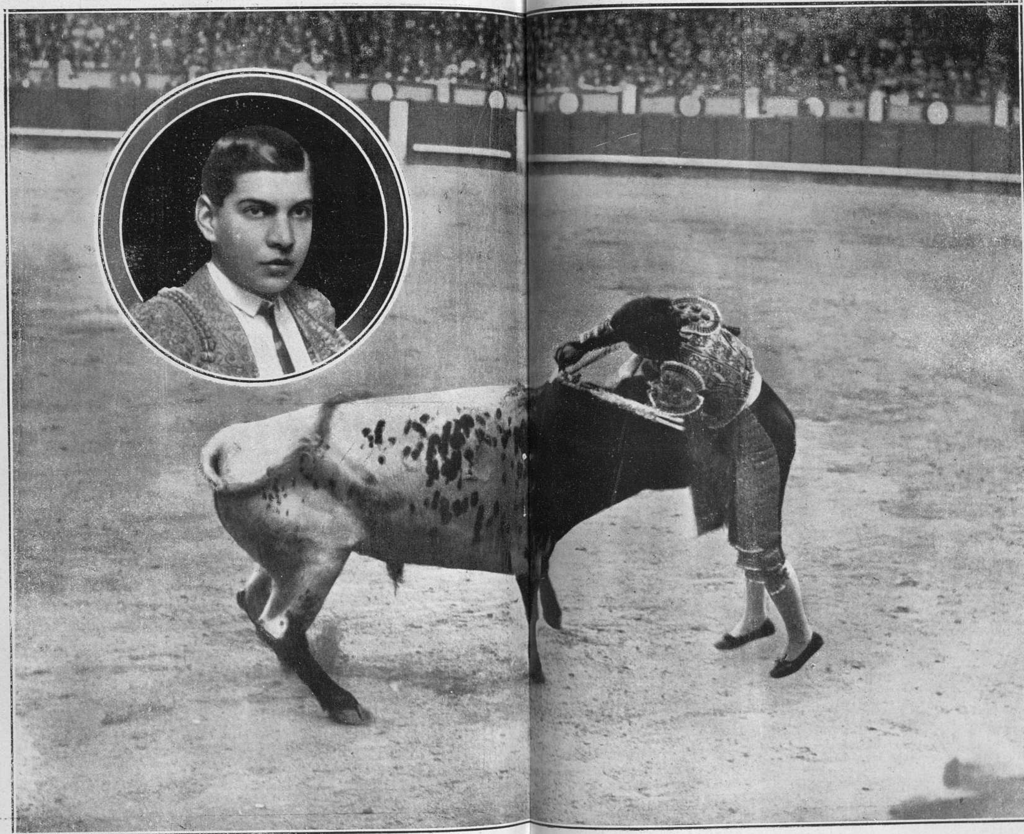
El diestro mexicano Rodolfo Gaona, pasaportando un toro en una de las últimas corridas toreadas en Madrid. El matador entró muy valiente, pero en su manera de estoquear se aprecian tres defectos: está matando de salto, lleva arqueada la mano derecha, y la izquierda sumamente alta.