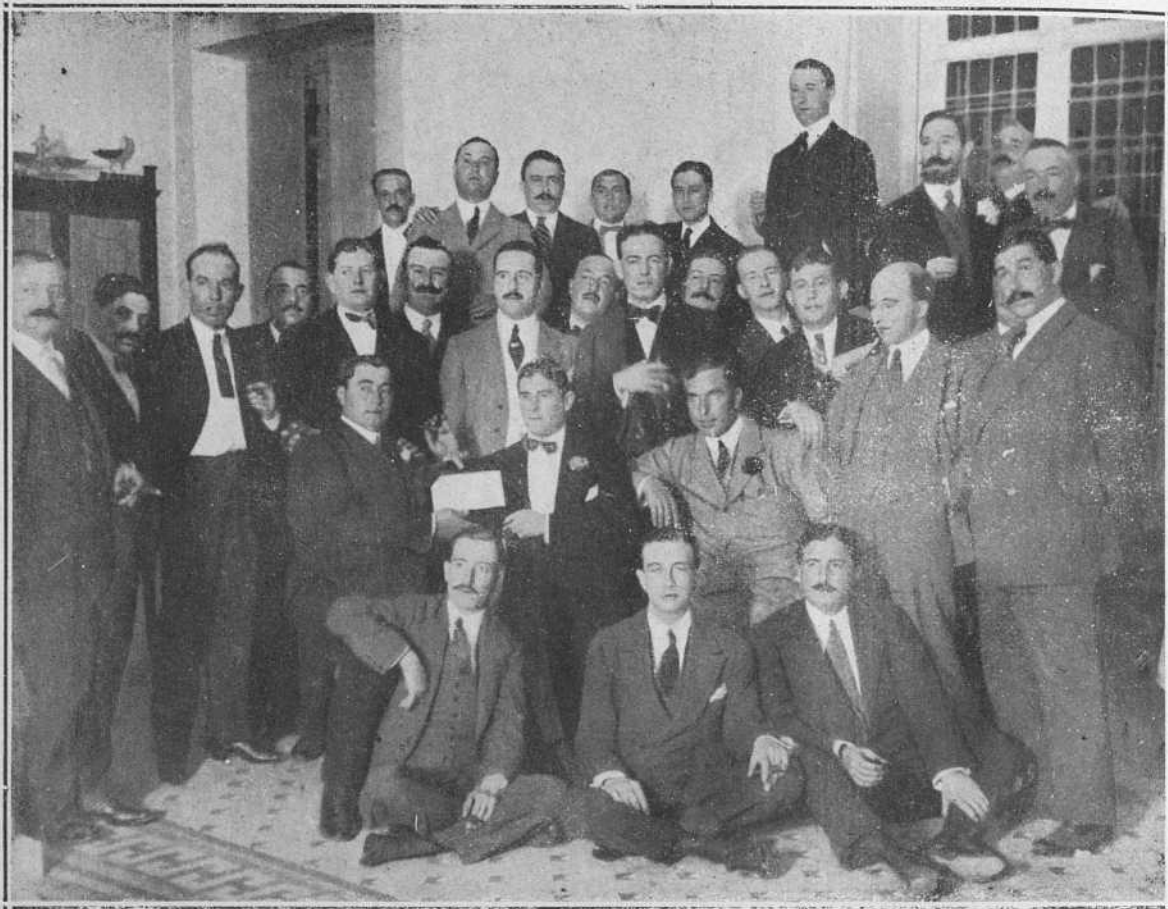
En Sevilla se ha celebrado un banquete en honor del aplaudido matador Curro Vázquez , que ha realizado en 1914 una brillante campaña toreando 34 corridas y dejando de torear por distintas causas, 6. Al acto concurren distinguidísimos aficionados y los ex diestros Emilio Bombita y Algabaño , que en la fotografía de Arenas, que publicamos, aparecen sentados teniendo en medio a Martín Vázquez .