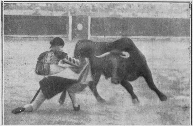
Valencia, 18 de Octubre.—Joselito en un adorno.