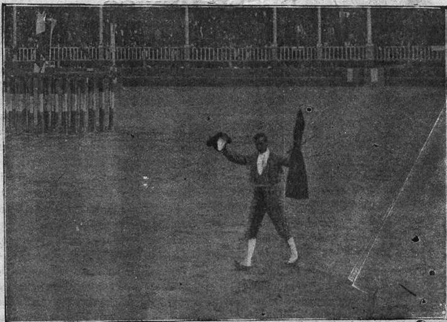
OVACIÓN Á «TRONÍ» POR LA MUERTE DEL QUINTO TORO

enemigo, que desarmaba un poquito, pero luego se embarulla, invierte la faena con pases por alto, sufriendo varias coladas y sin cuadrar atiza