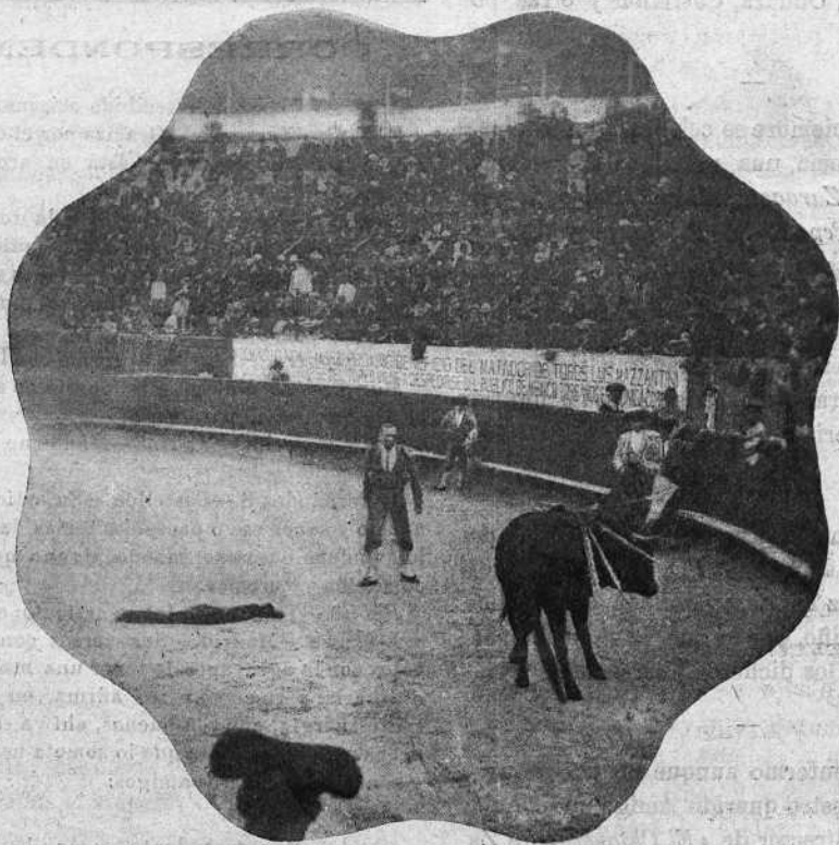
UN DESARME DE «BONARILLO» EN EL PRIMER TORO