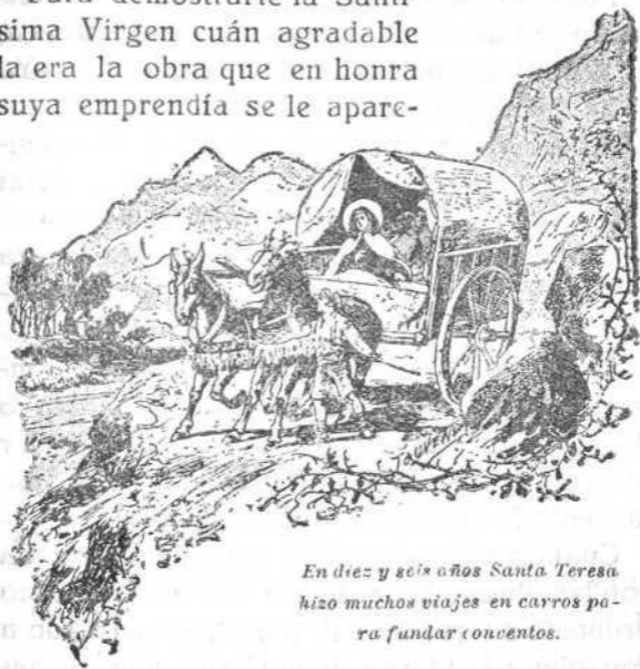
En diez y seis años Santa Teresa hizo muchos viajes en carros para fundar conventos.

Para demostrarle la Santísima Virgen cuán agradable la era la obra que en honra suya emprendía se le apare-