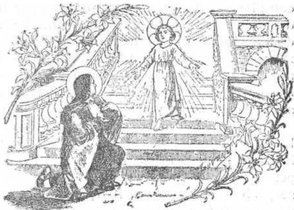
Yo soy Teresa de Jesús.—Yo Jesús de Teresa.

frimiento en cosas interiores, «pasé,—dice ella misma—el año del noviciado, grandes desasosiegos con cosas que en sí tenían poco tomo; mas culpábanme sin tener culpa hartas veces, yo lo llevaba con harta pena e imperfección, aunque con el gran contento que tenía de ser monja, todo lo pasaba. Como me veían procurar soledad, y me veían llorar por