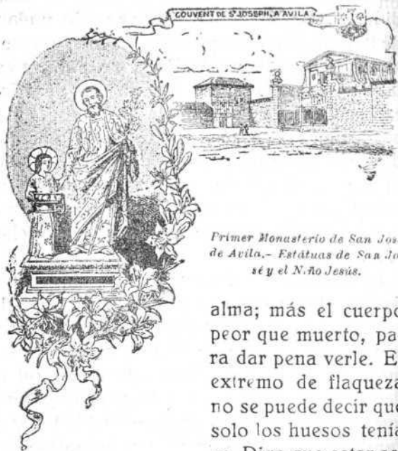
Primer Monasterio de San José de Avila.— Estátuas de San José y el Niño Jesús.

dice en el cap. VI de su vida. Algo aliviada, dió gran prisa porque la llevasen al convento. «A la que esperaban muerta, dice, recibieron con