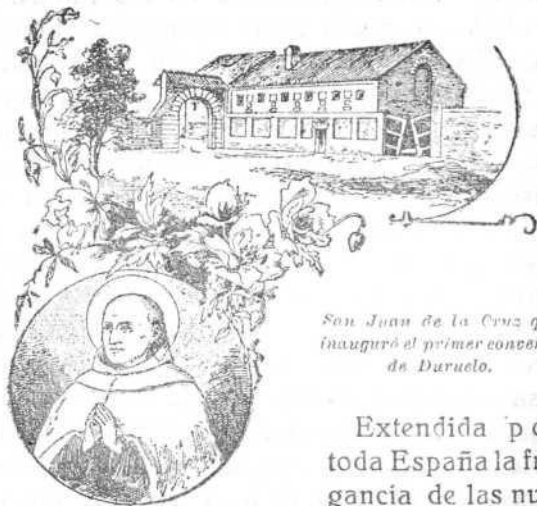
San Juan de la Cruz que inauguró el primer convento de Duruelo.