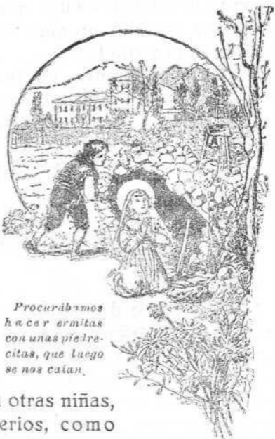
Procurábamos hacer ermitas con unas piedrecitas, que luego se nos caían.

Hacia limosnas como podía; procuraba soledad para rezar mis devociones, que eran hartas, en especial el rosario de que mi madre era muy devota y nos hacía serlo. Gustaba mucho, cuando jugaba con otras niñas, hacer monasterios, como que éramos monjas, y yo me parece deseaba serlo, aunque no tanto como estotro que he dicho.» (1), (Vida, cap. I, números, 5 y 6).