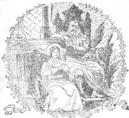
Vi que el estado religioso era el mejor y más seguro.

breve, y a temer, si me hubiera muerto, cómo iba al infierno; y aunque no acababa mi voluntad de inclinarse a ser monja, ví era el mejor y más seguro estado; y así poco a poco me determiné a forzarme para tomarle. En esta batalla estuve tres meses, forzándome a mí