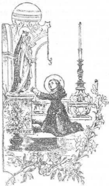
Supliqué a la Virgen fuese mi madre con muchas lágrimas.

a los pies de la segunda suplicándole fuese su madre. «Cuando murió mi madre, (1527) dice élla, quedé yo de edad de doce años poco menos. (1) Como yo comencé a entender lo que había perdido, afligida fuíme a una imagen de Nuestra Señora y supliquéla fuese mi madre, con muchas lágrimas. Paréceme, que aunque se hizo con simplicidad, que me ha valido; porque conocidamente he hallado a esta Virgen soberana en cuanto me he encomendado a ella, y