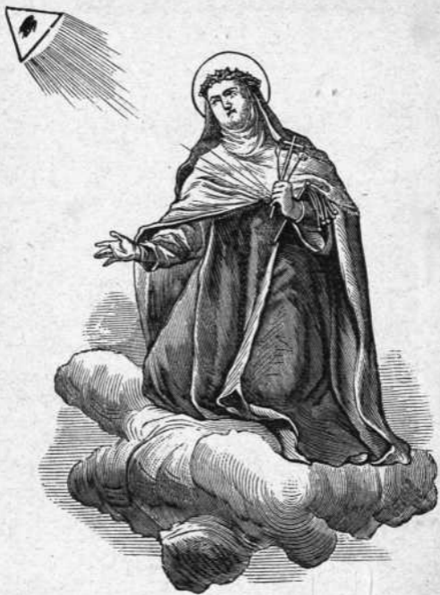
SANTA MARIA MAGDALENA DE PAZZI, CARMELITA.