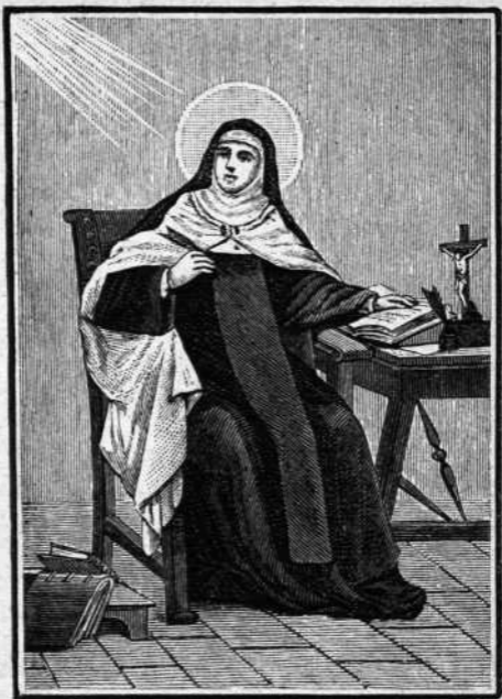
SANTA TERESA DE JESÚS, CARMELITA.