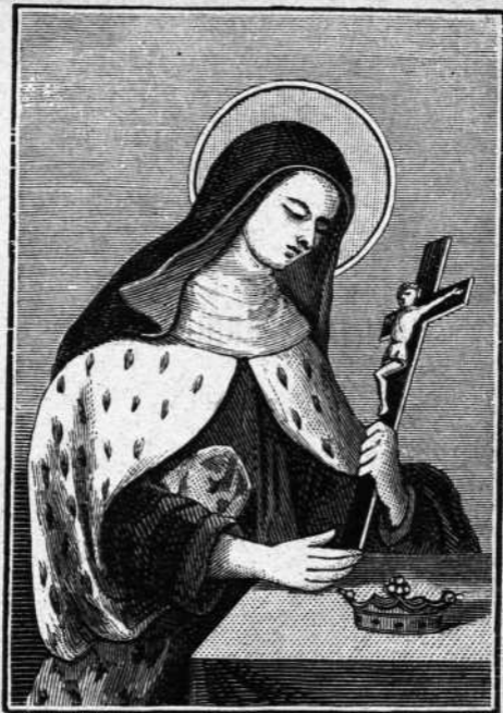
BEATA FRANCISCA DE AMBOISE, CARMELITA.