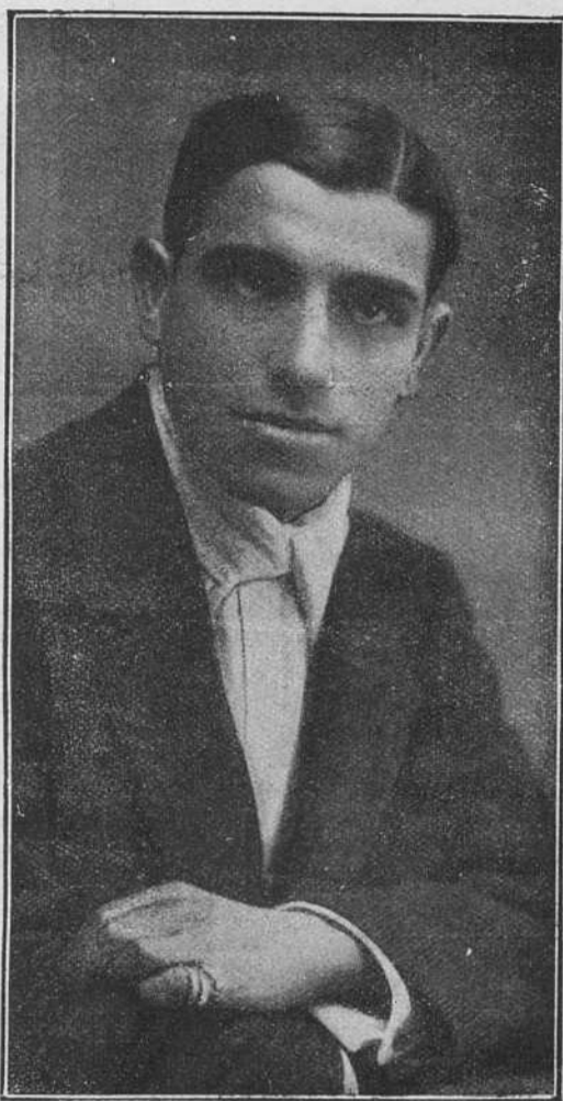
El valiente matador de toros Juan Belmonte, que entrenándose en el toreo, al practicar la suerte de matar, fué alcanzado y herido de importancia por una vaca en Salamanca.

Valencia II , o el niño de los desplantes, se limitó a dar unos cuantos farolillos, como si se tratara de una novillada nocturna.