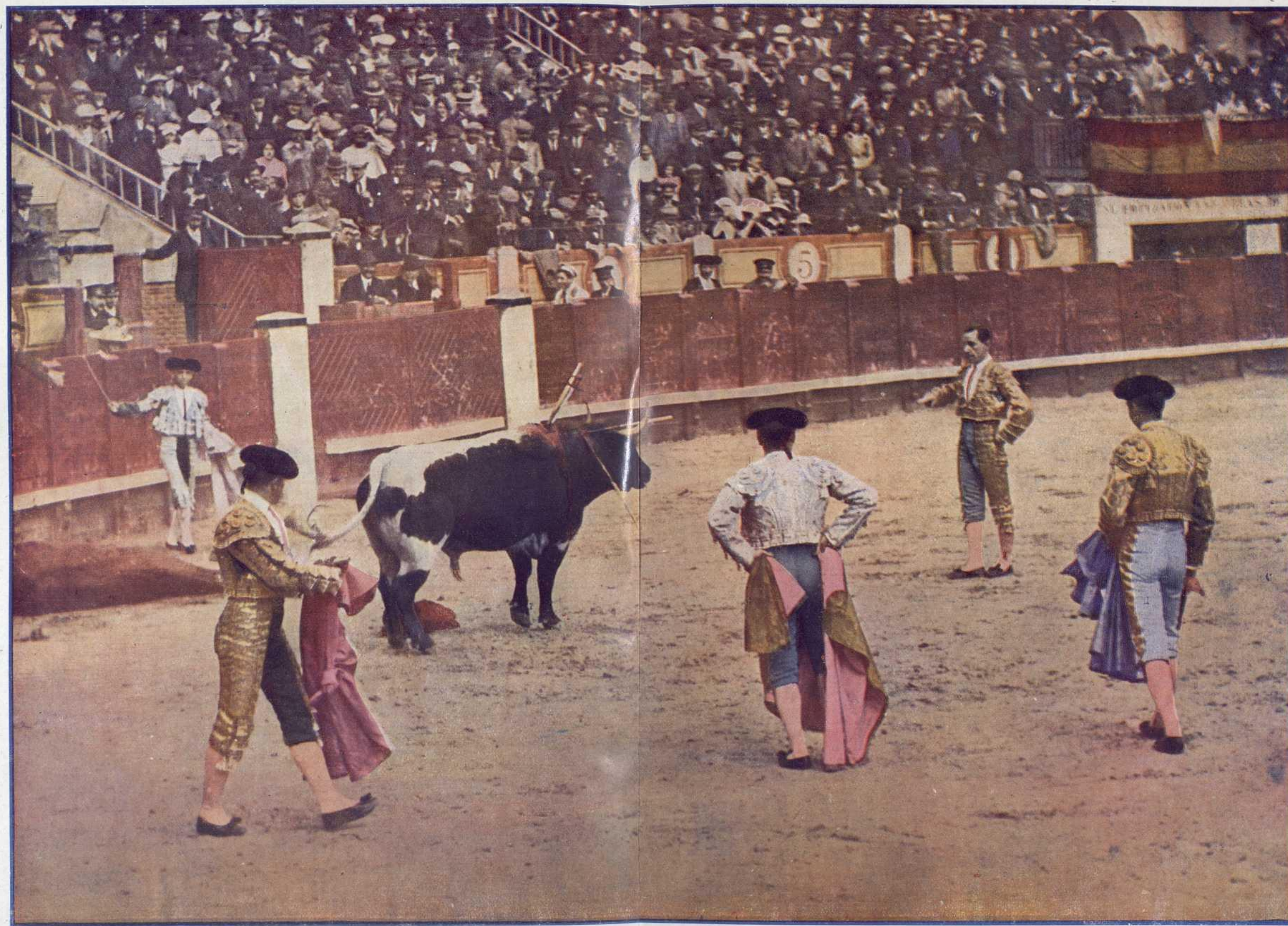
El valiente Vicente Pastor después de la gran estocada con que coronó la hermosa faena hecha con un toro de Veragua en la cuarta corrida de aþono, y cuya muerte brindó á los ex toreros Bombita y Machaquito.