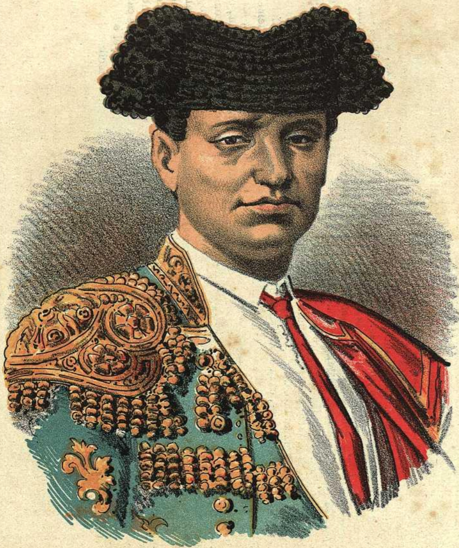
RAFAEL MOLINA (Lagartijo.)