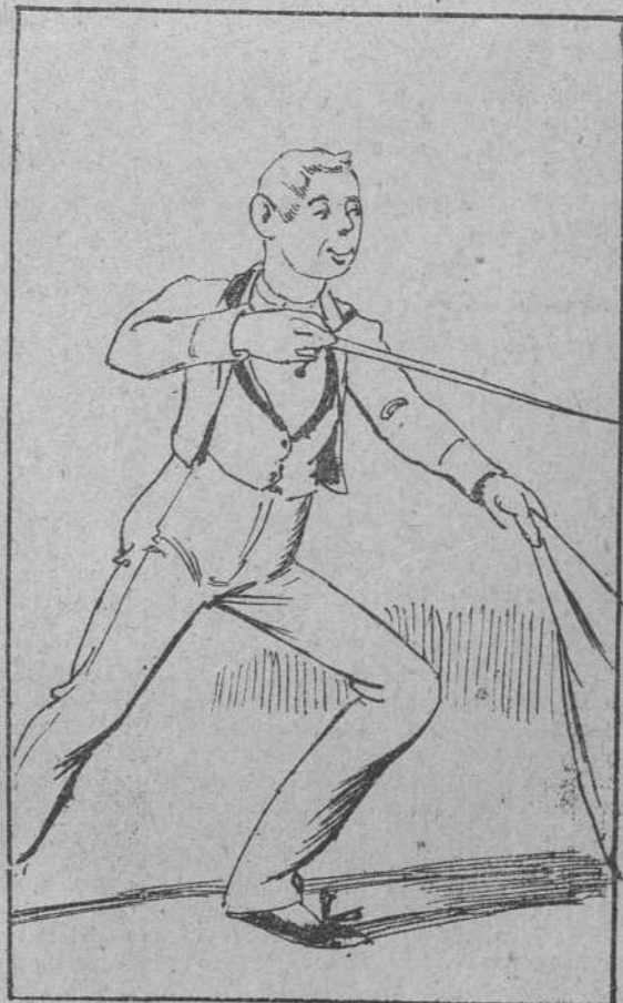
7. aparentando tener tranquilidad de conciencia, porque el chico, al parecer, recibía con frecuencia.