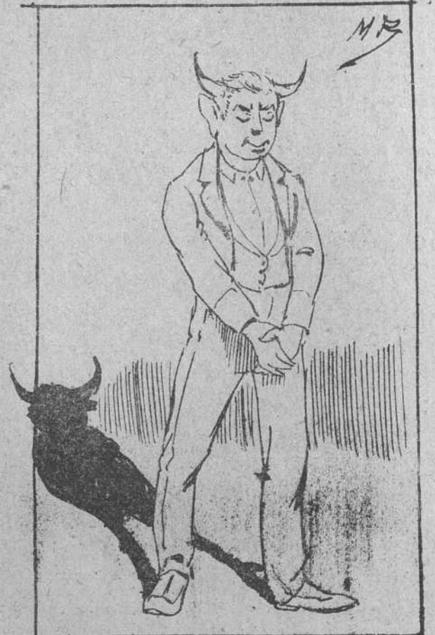
10. que había sido el maestro en lo de buscarle estado y le hacía en vez de diestro, conudo y apalcado.