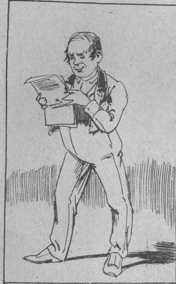
4. Según sus cartas, progresos constantes el chico hacía, y aseguraba ser de esos que honran á la torería;