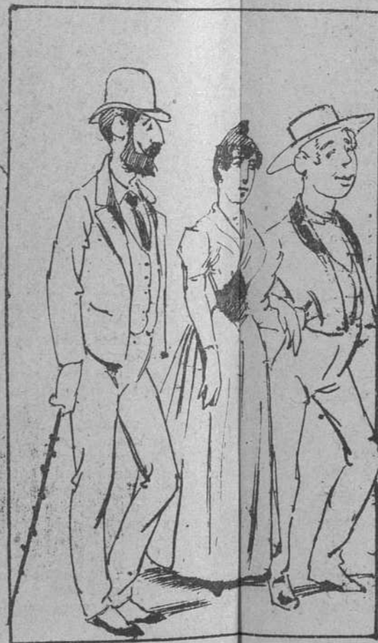
8. Llegó por un instante de regresar á la corte el matrimonio flamante y un primo de la consorte.