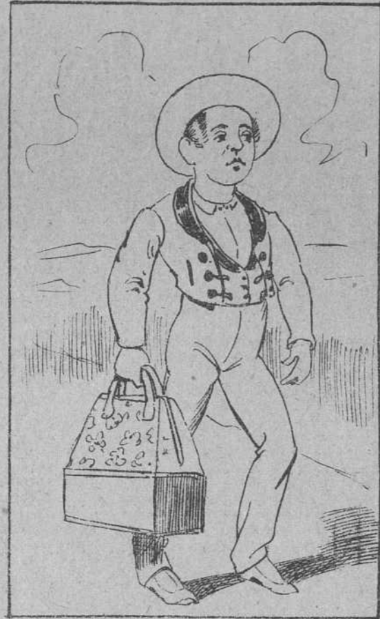
2. Le nombraron Rafael, le apodaron Taleguilla, y enviaron al doncel al ser púber á Sevilla.