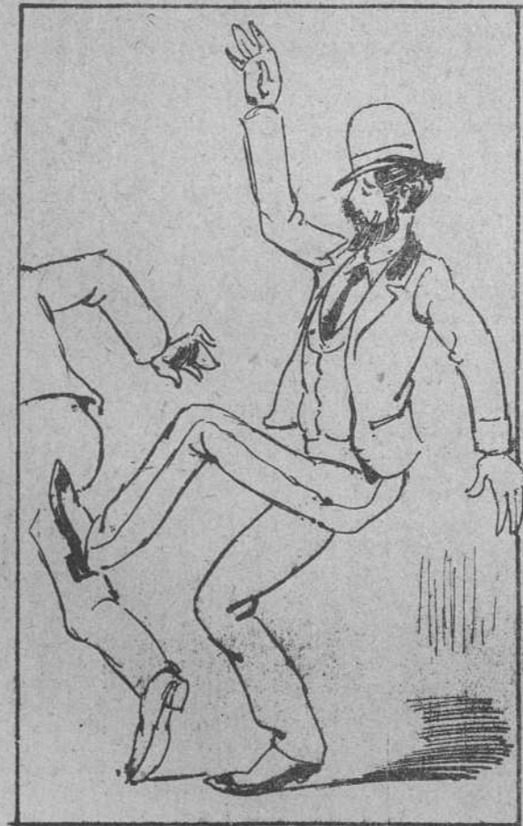
9. Y el muchacho largó el timo: nada de lidiar sabía, y los sopapos del priac era lo que recibía;