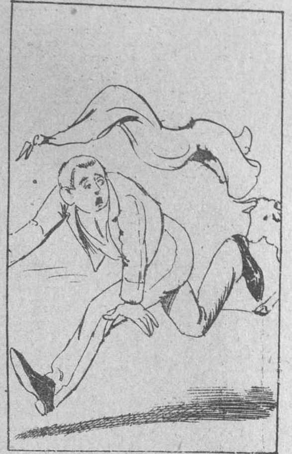
5. tal, que no había cumplido los veinte, ni por asomo, y había el hombre corrido vaquillas con cierto aplomo.