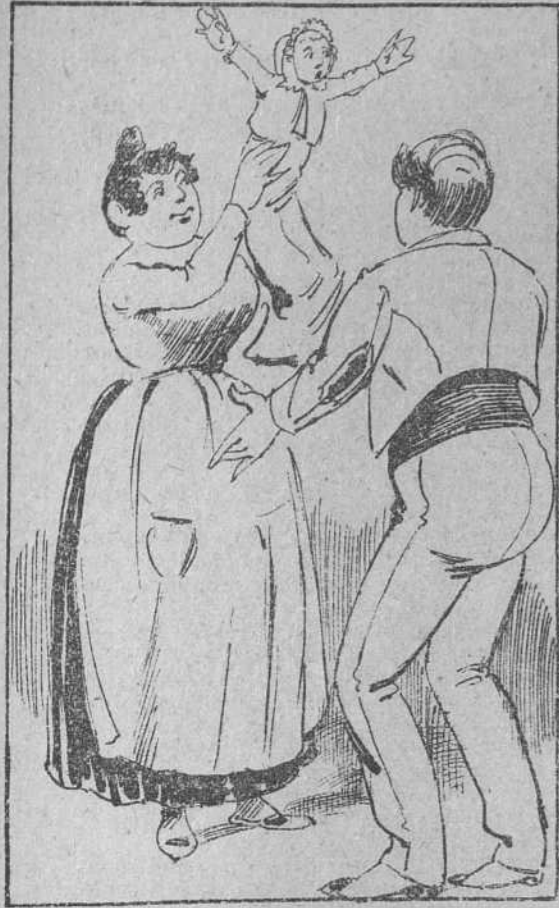
1. A un amante matrimonio muy flamenco y muy torero, le dotó Dios ó el demonio de un chiquitín sandunguero.