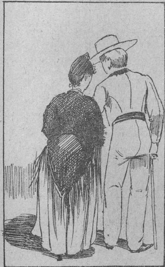
6. Gozando ya de esta fama se empeñó el mozo en casarse y el padre, aunque con escama no se aventuró á negarse.