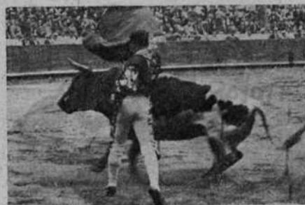
Freg en un muletazo por alto

Freg, colosal, otro matador mal. Martínez, bien.