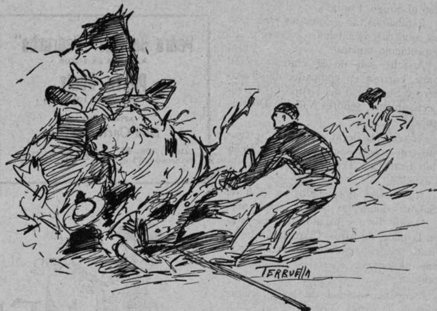
Emocionante caída de Barretina y arrojo de "El Hiena" sacando al caído de debajo las patas del veraguéño.

so con los capotes las cuadrillas, cumplimentaron al Usia salvándose de la dinamita . Como la lidia no se llevó siempre con el debido orden y concierto llegaron al último tercio algo recelosos y tapándose de ahí la actuación poco afortunada con el pincho del debutante Lagartito II , quien tuvo que ser avisado en sus toros. Muy voluntarioso estuvo con la muleta y capote el baturrico , que fué en ocasiones aplaudido.