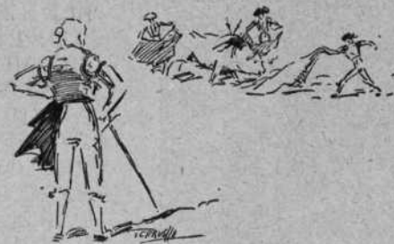
Facultades viendo con frescura glacial como sus subalternos torear