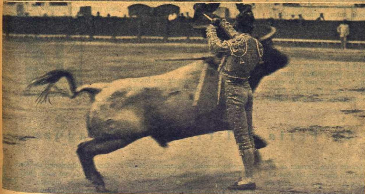
De manos de Rafael "El Gallo" y de testigo Juan Belmonte, tomó la alternativa este mago del capote en el Puerto de Santa María el día 28 del próximo pasado mes. A tal señor, tal honor. Obtuvo un éxito rotundo y fué aclamado por la afición. Este pase mayestático que aquí reproducimos es el en que empezó la faena en el toro de su alternativa. ¡Vaya majestad y figura!