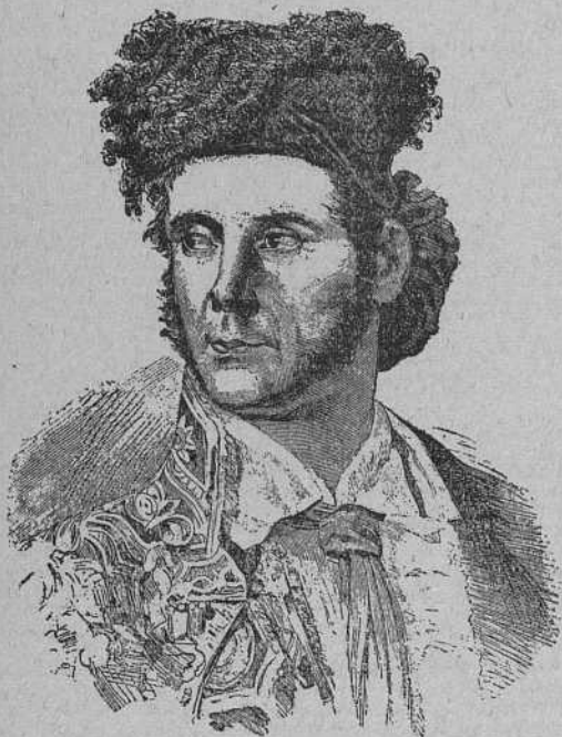
Francisco Montes (PAQUIRO)

El popular diestro Francisco Montes «Paquiro» decía para demostrar todo el mérito que había tenido el