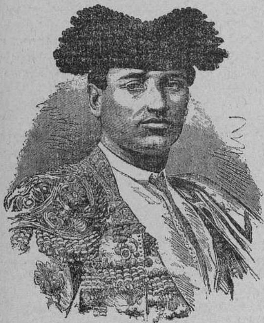
Rafael Molina (LAGARTIJO)

También decía: «No son los toros los que cogen; somos nosotros los que cogemos á los toros.»