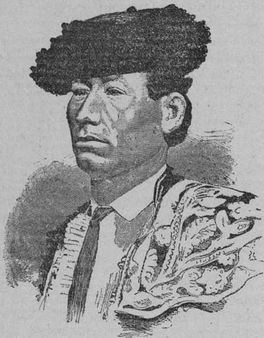
Francisco Sánchez (FRASCUELO)

Más que á las autoridades temía Paco á las iras del pueblo, y de aquí que consintiese que su nombre figurase en los carteles de la corrida, no sin el propósito de no llevarlo á cabo, aprovechando cualquier medio. Era español, y su trabajo no podía consentir sirviese contra su país, contra sus hermanos.