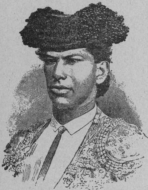
Salvador Sánchez (FRASCUELO)

Se presentó un empresario á comprar una corrida, y al enterarse el ganadero de que era Salvador el que había de torearla, estuvo un poco dudoso en venderla, hecho que no tardó en conocer «Frascuero».