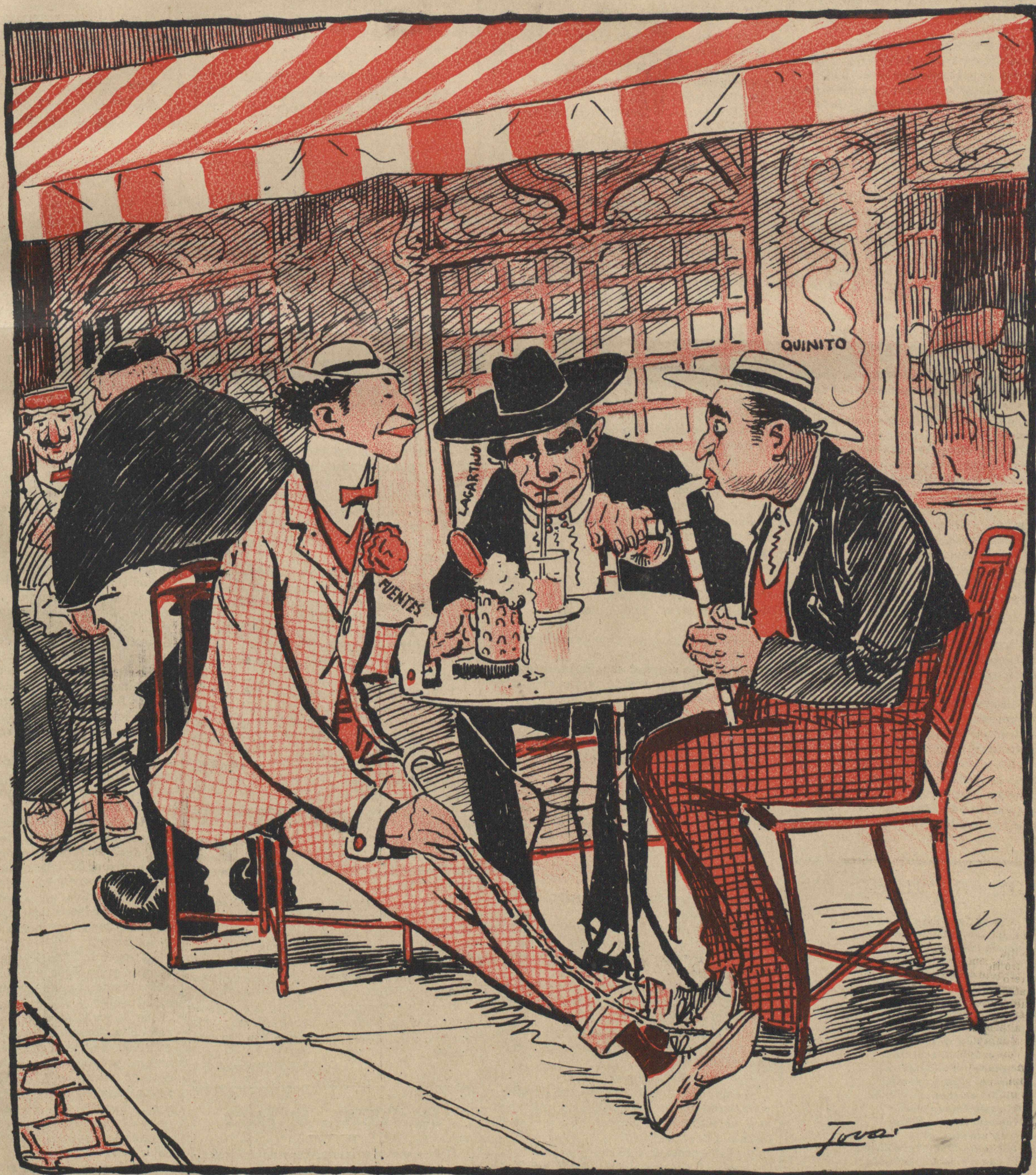
QUINTO.—¡Mirar que no habernos llevado á nosotros á Paris! FUENTES.—Una corridita no hubiera estado de más. LAGARTIJO.—Yo creo que los que estamos de más somos nosotros.