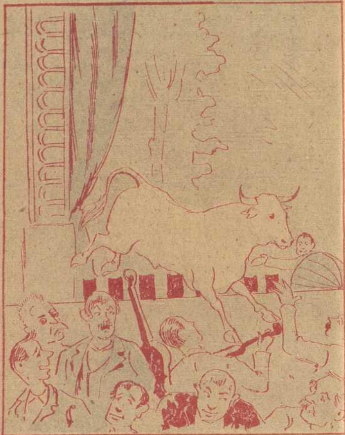
EN UNA REPRESENTACION DE PEPE-HILLO