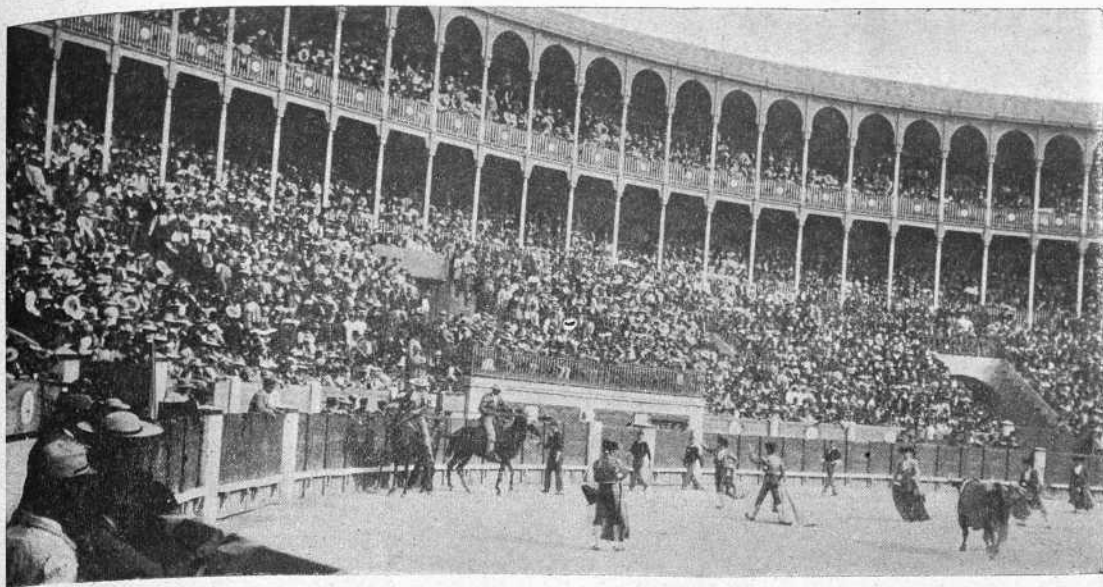
Lagartijo á la salida de un quite en el toro segundo.

Respecto de los matadores, no pudo haber lugar á duda.