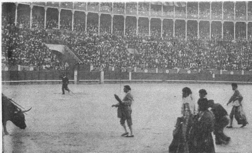
Machaquito después de la estocada á su segundo toro.

Lanceando de capa, ninguno se distinguió. En quites, Lagartijo y Machaquito .