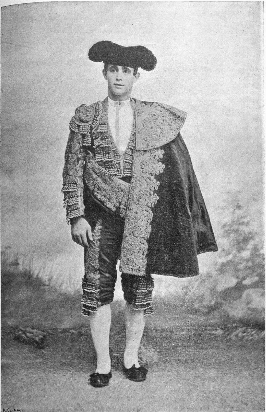
RAFAEL GONZÁLEZ ( Machaquito )