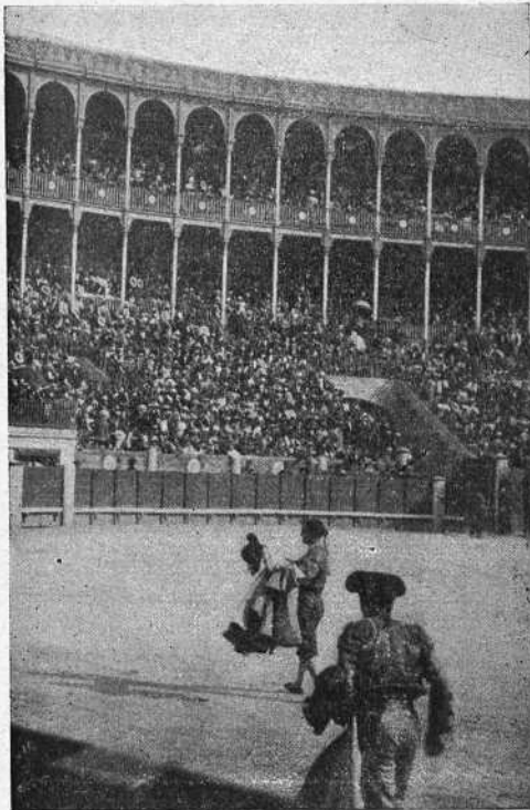
Ovación á Machaquito por la muerte del primer toro.

Algabeño chico y el hijo de aquel torerito tan bueno y tan fino, que fué en vida Fernando Gómez, son dos niños portentosos para aquella afición, ó mejor dicho, para la parte más apasionada de aquella afición.