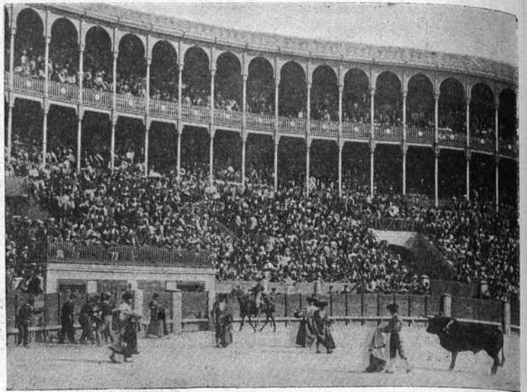
Machaquito á la salida de un quite en el primer toro.

Horrores dicen y escriben los sevillanos de los chicos de Córdoba, negándoles hasta las condiciones menos importantes para el toreo, y en cambio el