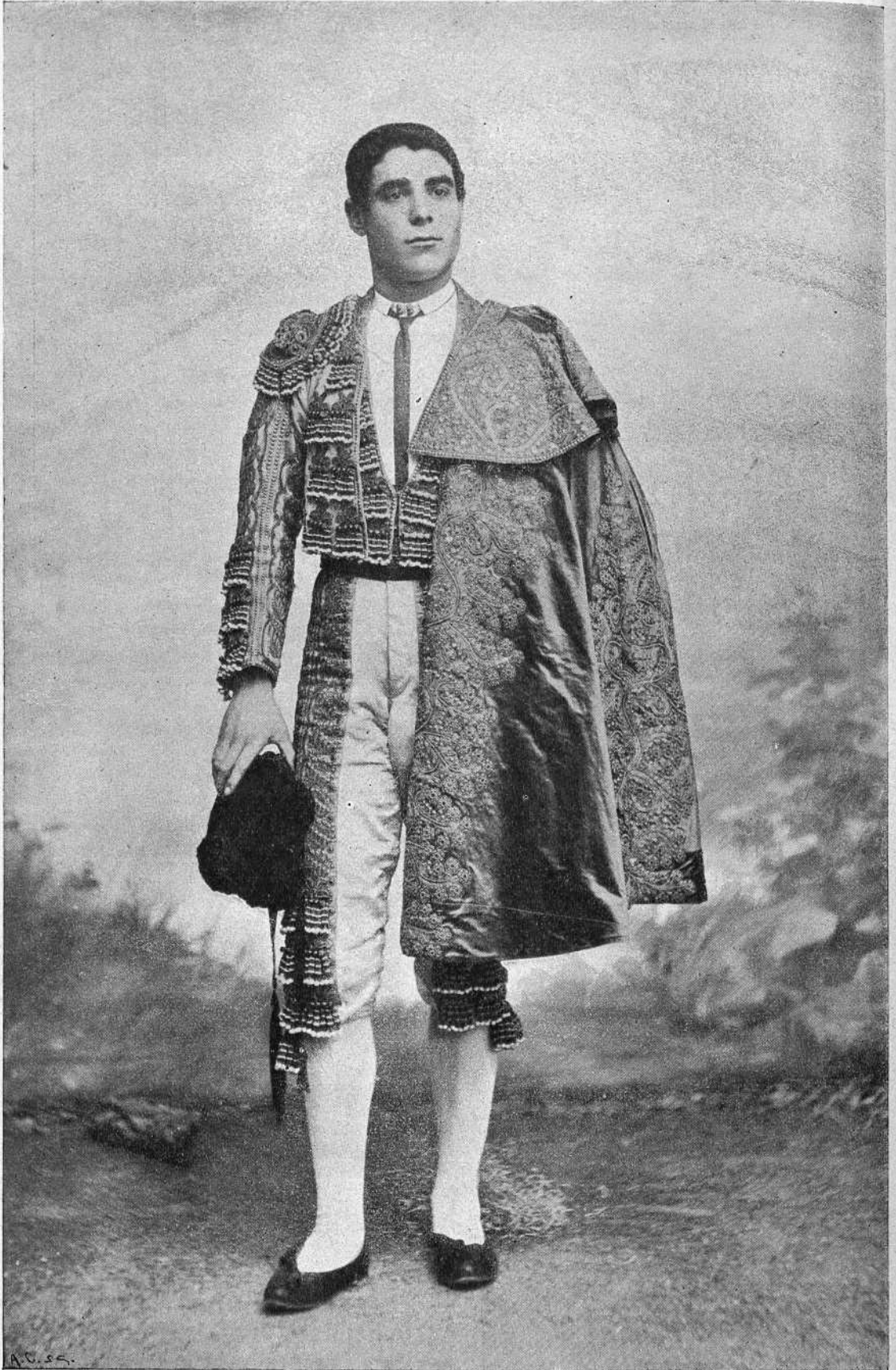
RAFAEL MOLINA ( Lagartijo )

(De fotografía de la Sra. Viuda de Crespón, de Nimes, hecha expresamente para SOL Y SOMBRA.)