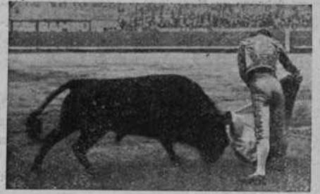
La verónica de Ortega

Gitanillo de Triana, del Niño de la Palma y de tantos toreros del día que, además de torear con un estilo depurado, aciertan a dar al mismo un sello personal que realza considerablemente la ejecución.