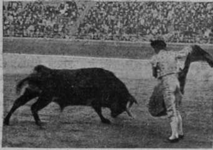
La verónica de "Cocherito"

Se ha dicho muchas veces, y se seguirá diciendo, que el toreo ha evolucionado considerablemente, dando no uno sino varios pasos de avance hacia una mayor belleza estética que lo ha-