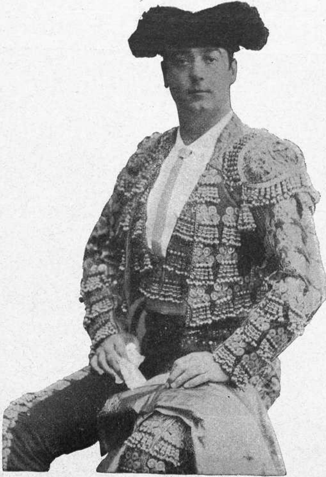
Mazzantini, matador de toros.

Sin llegar á tales extremos, fuera injusto desconocer la importancia de este torero que llena con su nombre página muy brillante de la historia del toreo contemporáneo. Matador en el circo, amateur en el teatro, caballero en su trato particular, patriota en América, burgués en el hogar, amante de la familia y consecuente en la amistad, la figura de Mazzantini tiene un gran relieve que me complazco en reconocerle; y si el torero no satisface las aspiraciones de los exigentes en arte, el