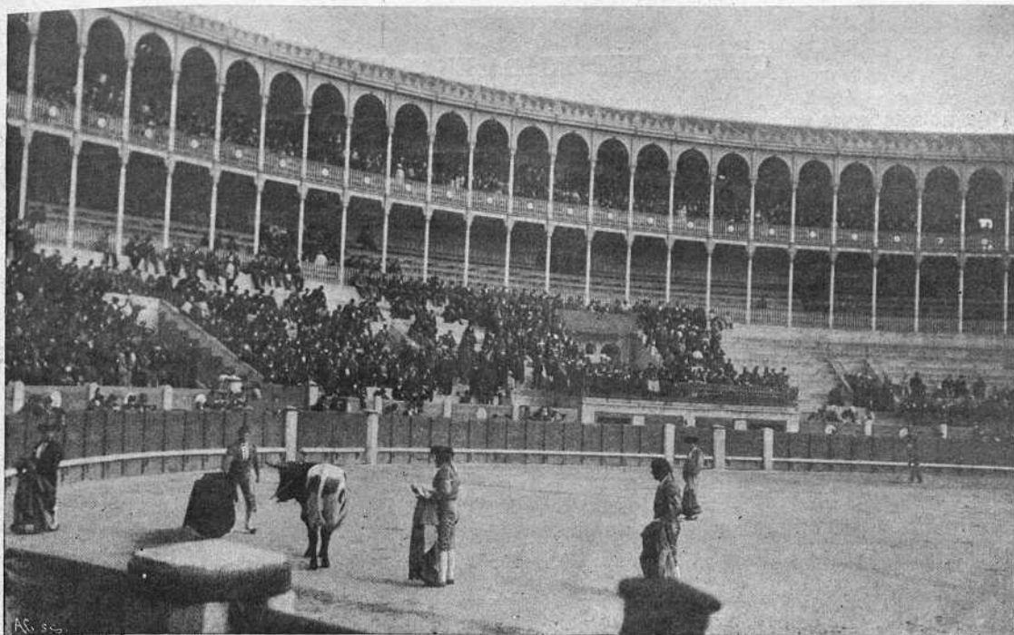
Bombita chico en su primer toro.