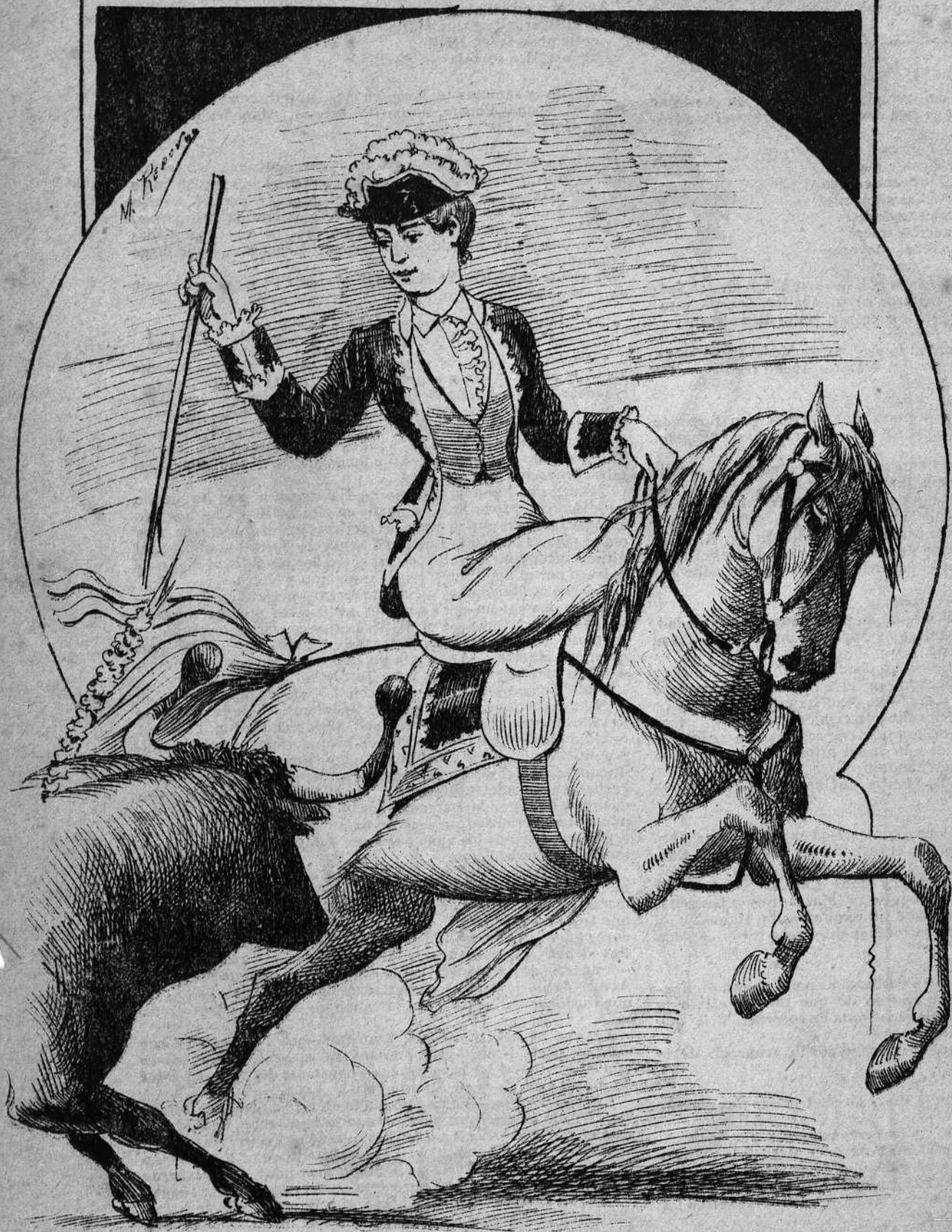
LA REJONEADORA PARISIEN