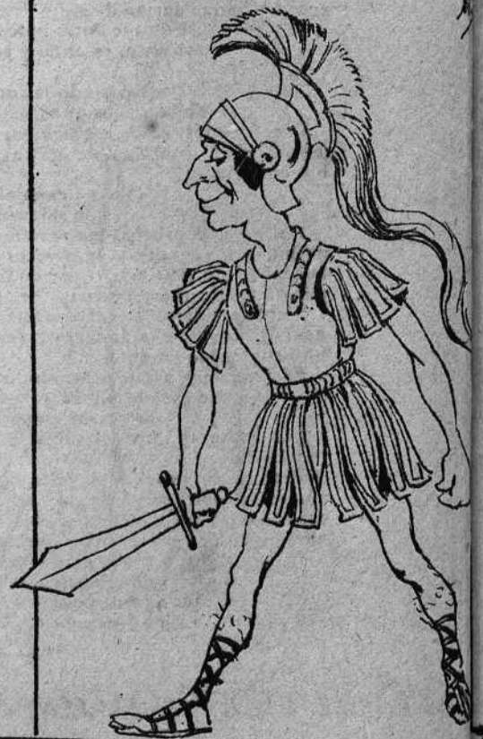
DISFRACES QUE USAN NUESTROS TOREROS EN LAS PANTOMIMAS