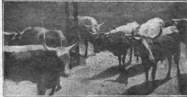
LOS TOROS EN LOS CORRALES