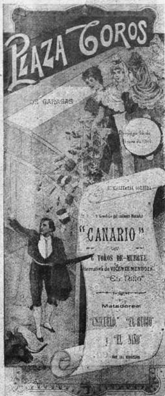
EL CARTEL DE LA CORRIDA

parando mucho y rematando algunos pases de rodillas y acabó con el bicho de una estocada corta en todo lo alto, saliendo tropicado. La ovación fué unánime.