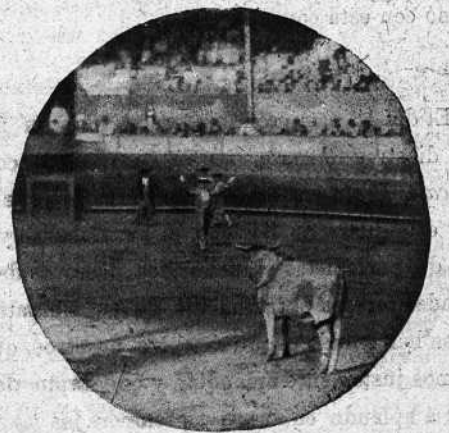
«CHICUELO» CITANDO PARA BANDERILLAR

En el último tercio acentuó su triunfo. Hizo una faena superior