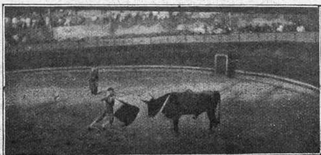
«CHICUELO» EN SU PRIMER TORO

Rubio. Toreó de capa y banderilleó regularmente al segundo toro. Matando estuvo desdichado, y pasó finalmente el toro al