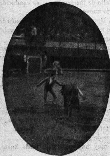
«CANARIO» EN SU PRIMER TORO