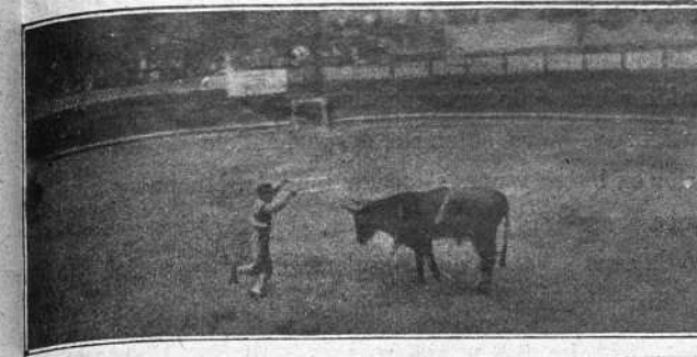
«ZOCATO» BANDERILLEANDO AL SEGUNDO TORO

En el primer toro, que era de mucho respeto y poder estuvo superior con el capote; cogió después las banderillas cortas y