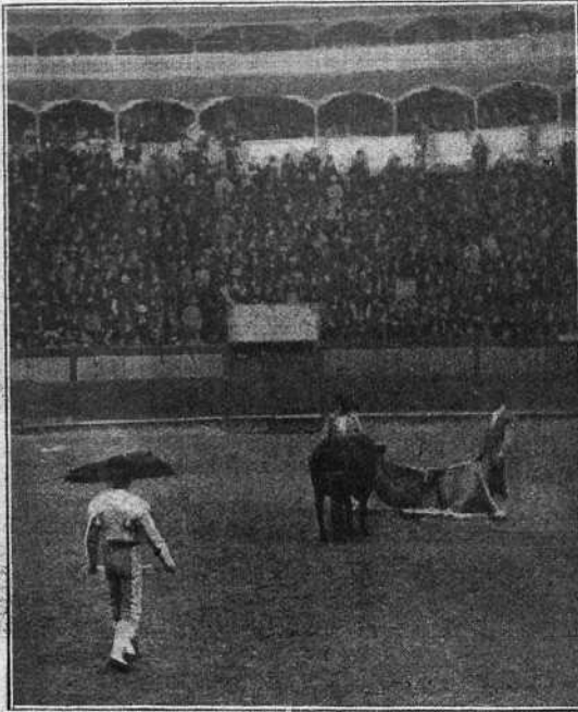
LOS MATADORES TOREANDO AL ALIMÓN

Mazzantinito equivoca la faena y nos aburre un gran rato, sufriendo incontables coladas y sustos á granel en estas condiciones deja un pinchazo en lo duro, luego se va sin toro, haciéndonos después el favor de terminar con un bajonazo. (Pitos).