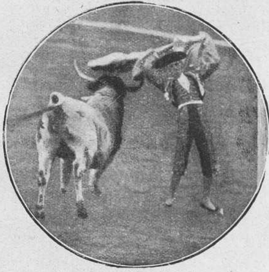
Almanseño el 3 en Barcelona.