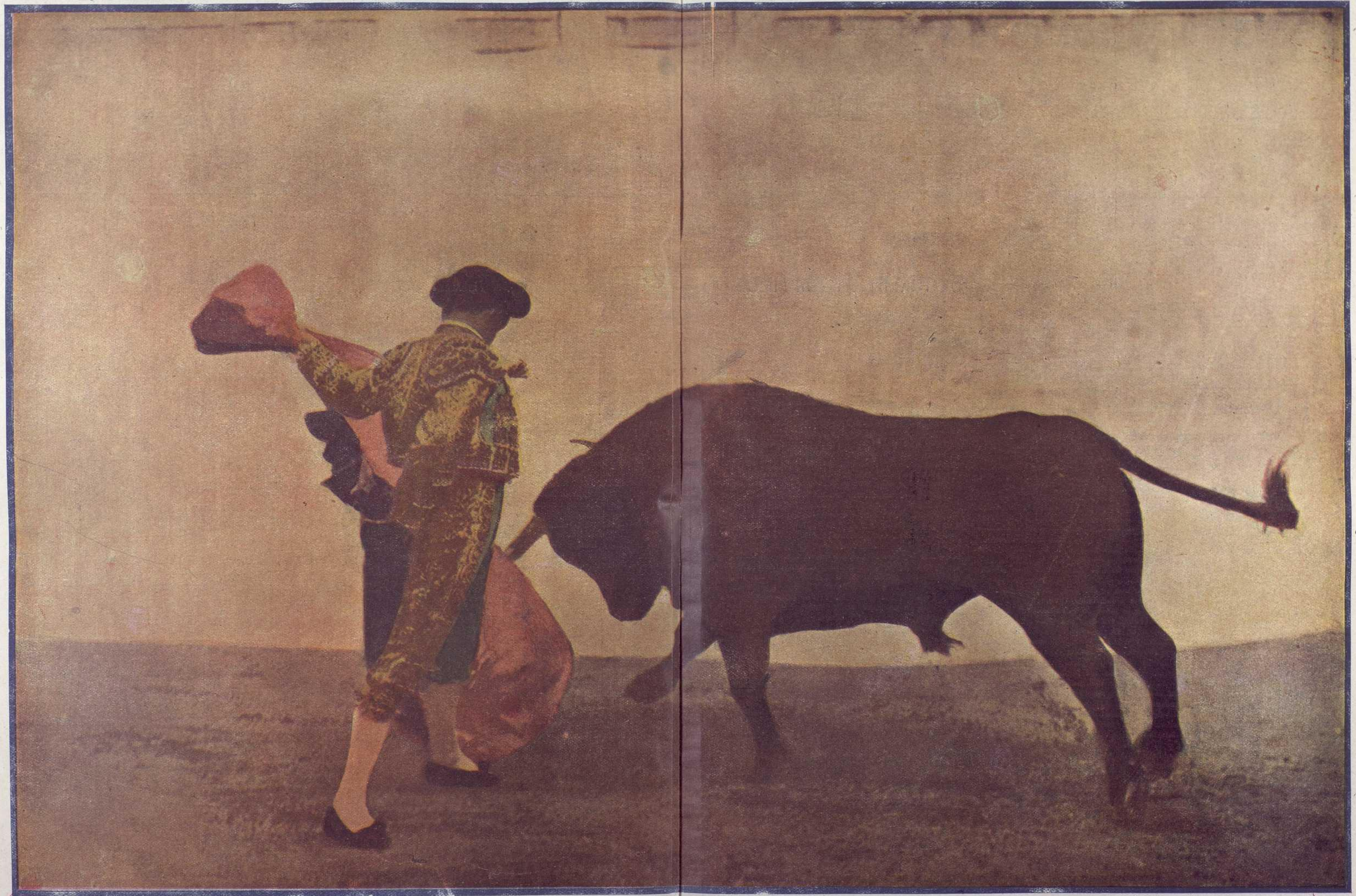
El valiente diestro toledano toreando superiormente con el capote con lances al costado.