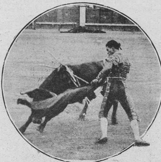
Méndez el viernes en Madrid.

Pesa mucho la plaza de Madrid para unos mu-