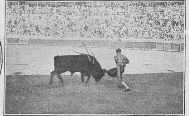
La Rosa el 10 en el Puerto de Santa María.