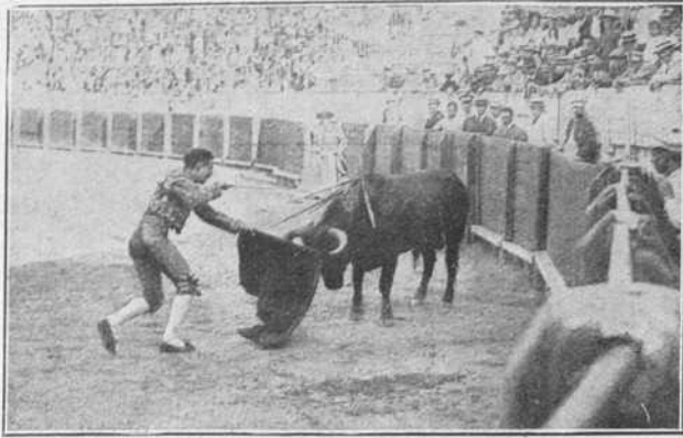
Méndez el 10 en el Puerto de Santa María.