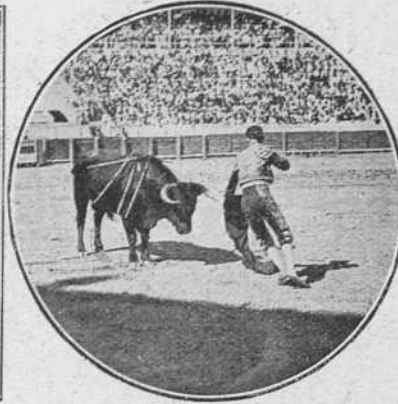
Amuedo en la misma corrida.