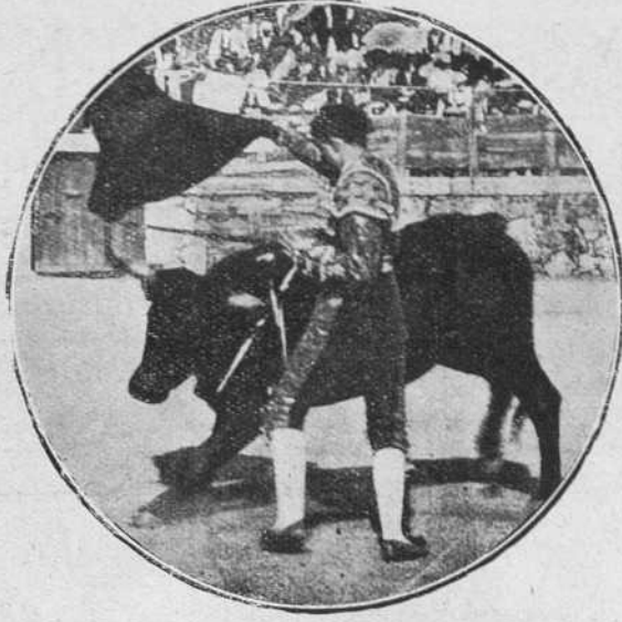
Marcial Lalanda en la misma corrida.