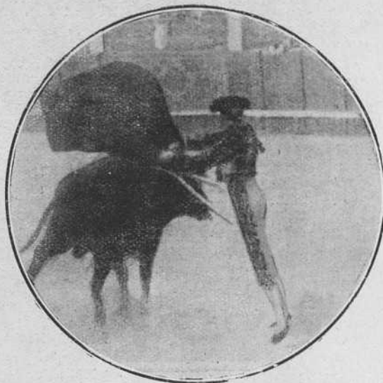
Chicuelo el viernes en Madrid.