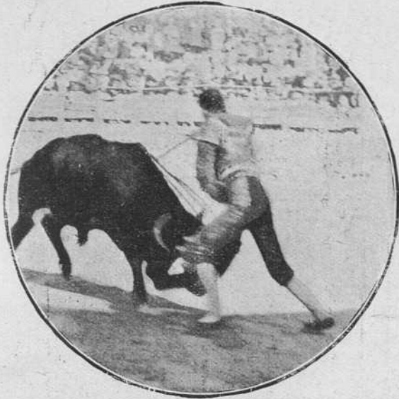
Pablo Lalanda el 10 en El Escorial.