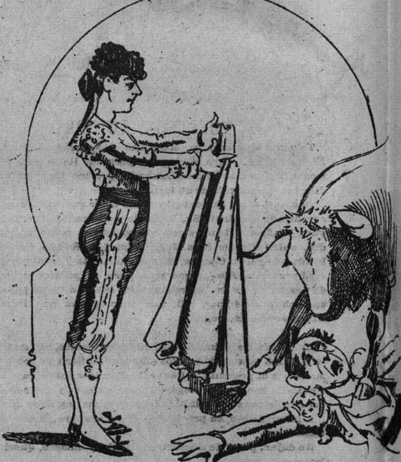
En los quites es sereno, tiene el toro verdad, rechaza las mojigangas y sabe al bicho empapar.