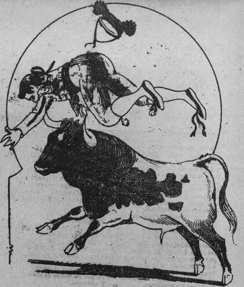
En Madrid uno de Miura un disgusto le causó, y la afición desde entonces por bueno le saludó.