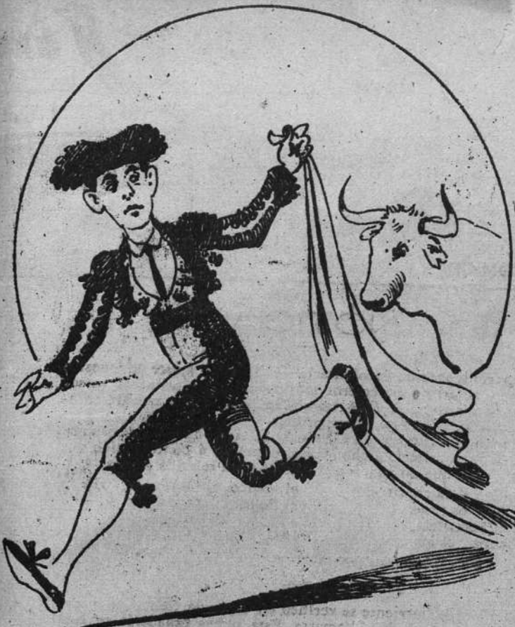
Cádiz y el pueblo natal vieron sus lances primeros, y empezó a volar la fama de su arte en Montevideo.