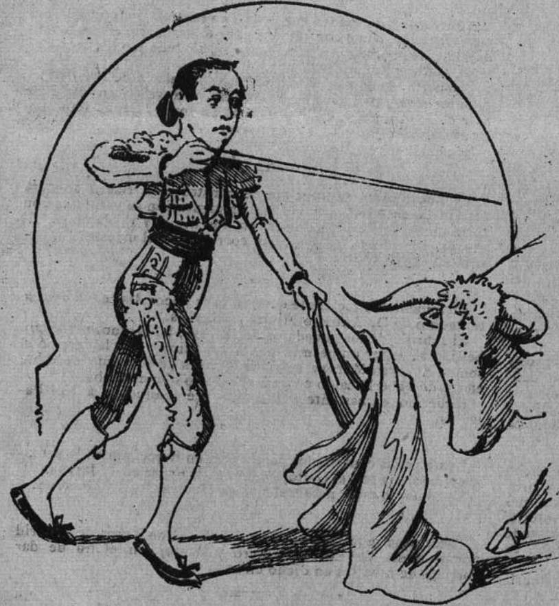
Cuando llega la ocasión es con el estoque un rayo, lía, se lanza, y el toro cae en la arena aplastado.