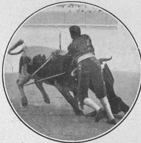
Julián Sánchez "Dominguín", matando un toro en una becerrada en la plaza de Madrid.

y 33 artobas) vieron bregar y perfilarse corto y derecho á este jovenzuelo pálido y endeble que ostentaba su cuello vendado cuidadosamente, como noble ejecutoria de valor in-