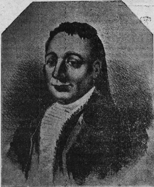
Retrato de Pepe-Ilo

De las muchas litografías, cromos, grabados en madera, fotograbados, acuarelas, etc que en nuestros días se han hecho por multitud de artistas representando la trágica muerte de Pepe-Ilo , nada diré porque resultaría esta nota de proporciones por demás extensas. Sólo apuntaré para concluir la algunas palabras acerca del retrato de Pepe-Ilo .