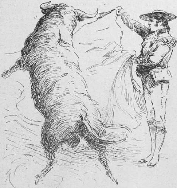
En tiempo de Pepe-Illo.

vantaron en España algunos circos, tales como el de Sagunto, rival de los de Itálica, y los de Tarragona y Mérida. Y antes de ellos, existieron otros de madera.