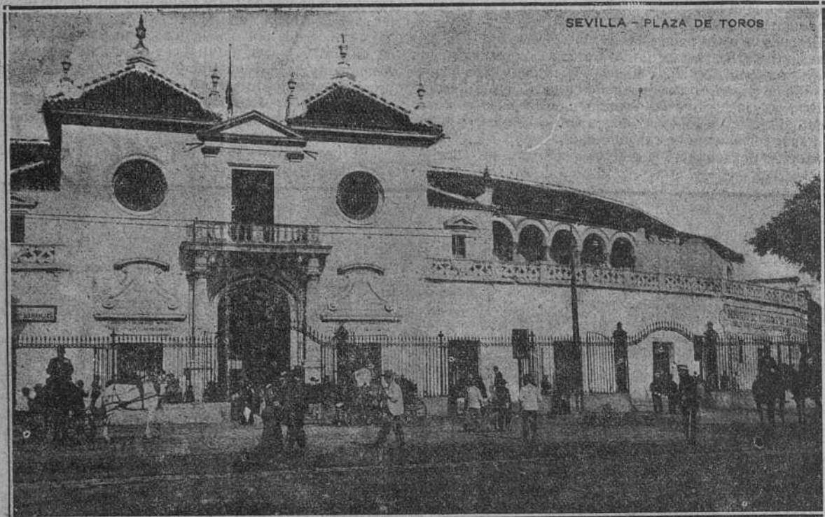
Plaza de toros de Sevilla.

su contracción muscular y el poder de su cabalgadura; y de aquí resultó la suerte de vara en sus diferentes formas, y según las disposiciones particulares de cada jinete.» Y así sigue llegando al toreo de á pie «perfeccionado desde la rústica manta del campesino hasta la flámula roja del diestro jefe de la cuadrilla de lidiadores». Y así continúa, explicando la lidia de toros, como una consecuencia de la ley primaria é invariable de la necesidad.