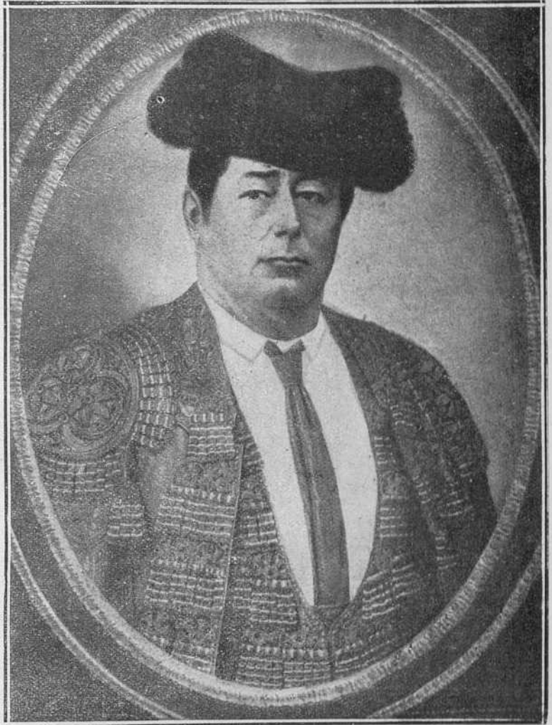
Cúchares, el célebre competidor del Chiclanero.

las corridas nacieran en España durante la dominación de Roma. Este pueblo edificó los monumentos para los juegos circenses, y como en España había hombres valerosos y toros bravísimos, no tiene nada de particular que un día se juntasen los tres elementos necesarios para una corrida y naciesen, aunque rudimentariamente, éstas. Desde la invasión de los bárbaros debió continuar la costumbre de lidiar reses bravas, pues en el siglo XIII ya se legisla sobre una costumbre, al parecer antigua, y ya se habla de toreros profesionales.