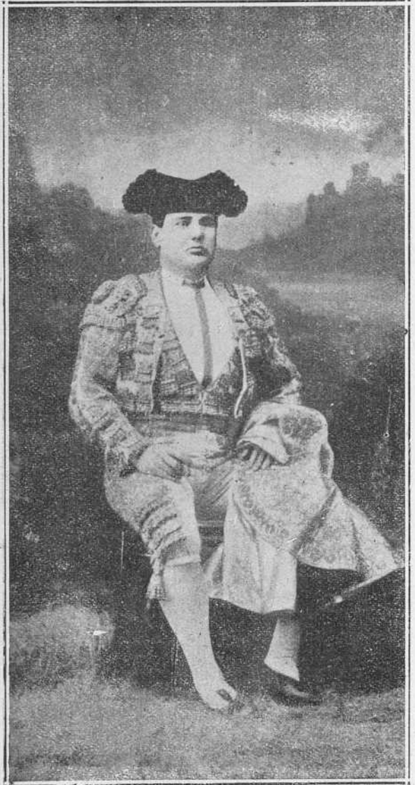
Gordito, aplaudido competidor del Tato.

Sabido es que á principios del siglo v los bárbaros (llamados así, no por su brutalidad, sino porque eran extranjeros, y la palabra «bárbaro» significaba entonces algo como «huesped») se adueñaron de la Península, entrando