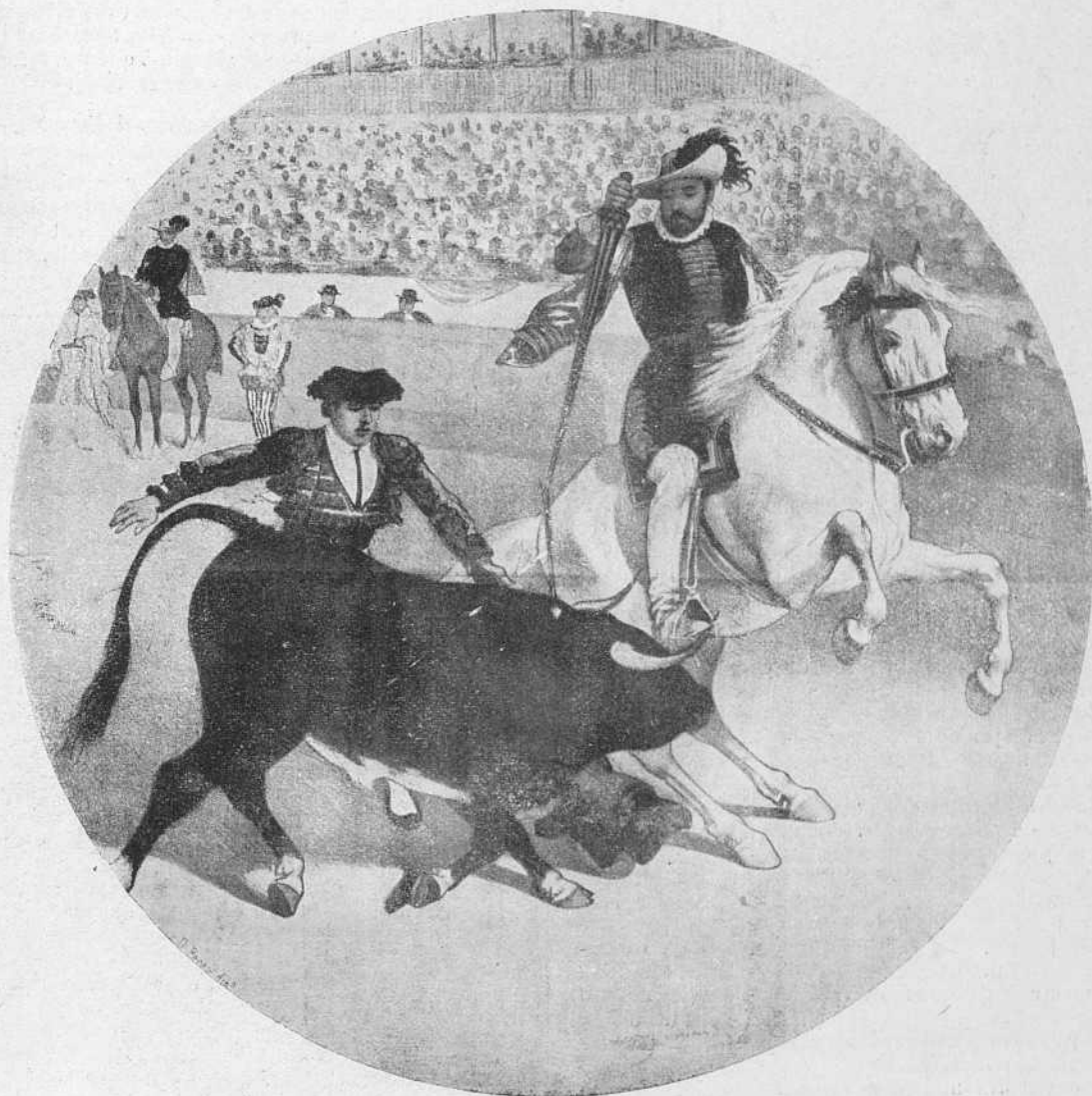
Caballero español rejoneando á un toro.

Pero después de toda esta serie de toros, ó mejor dicho,