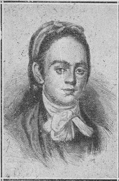
Costillares, uno de los diestros que sostuvieron competencia con Pedro Romero.

res. Ambos pretendían tener derecho á matar el primer toro. Y como la cuestión de alternativas no estaba aún resuelta en los términos que luego se hizo, hubo necesidad de acudir á la suerte, la cual favoreció á Pedro Romero, y así se consignó en el anuncio de la corrida». Efectivamente, en el programa se decía: «Primeros espadas: Pedro Romero, Joaquín Rodríguez Costillares, por