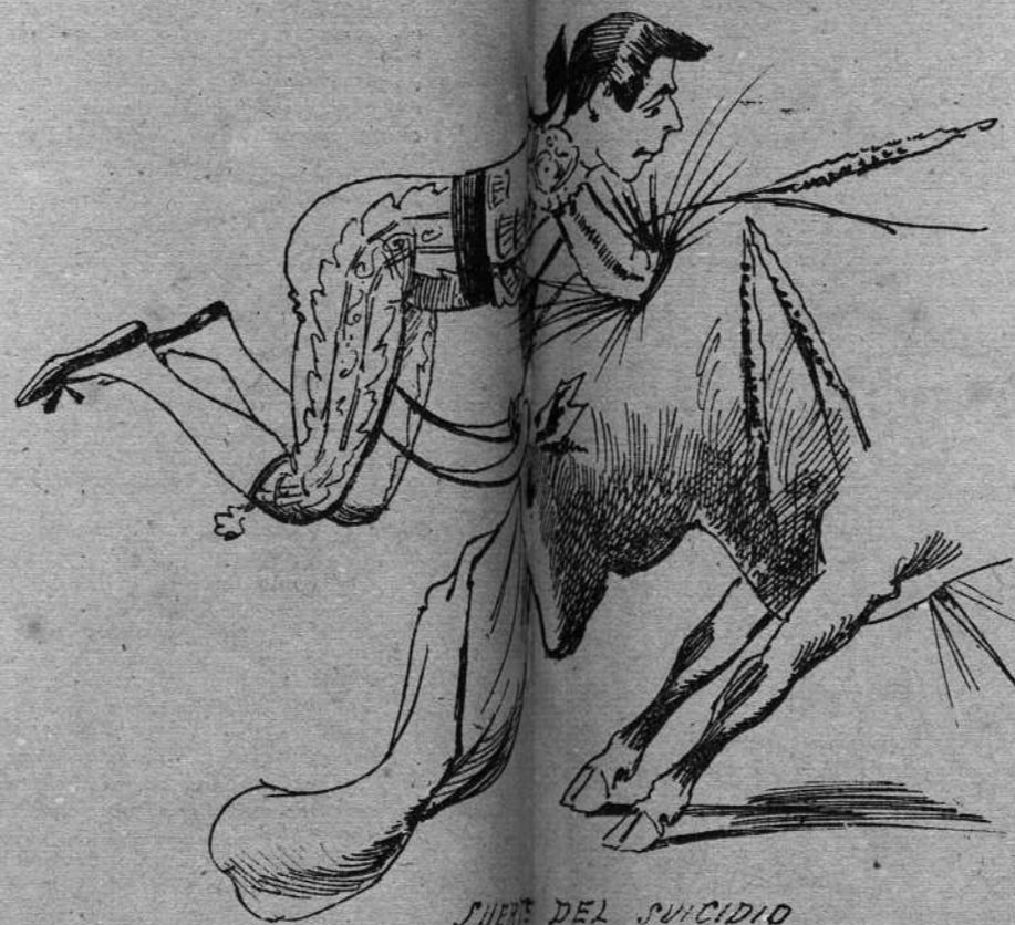
SUERTE DEL SUICIDIO