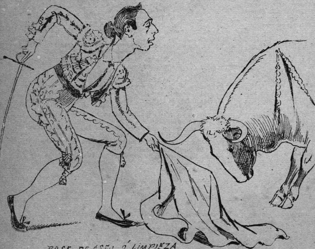
PASE DE ORO O LIMPIEZA