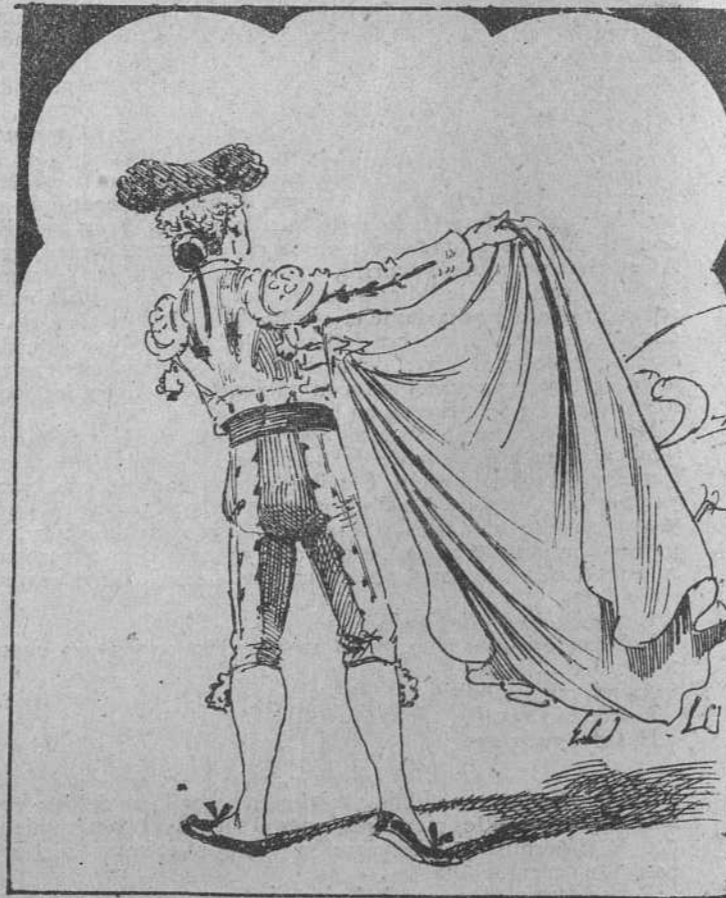
6. Y con cuatro capotazos como en sus tiempos mejores, libró de cien batacazos á tan bravos lidiadores.