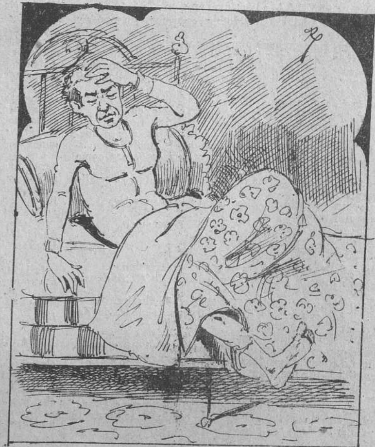
8. afirman que se echó fuera... de la cama el gran torero y exclamó de esta manera: — ¡Qué sueño tan verdadero!