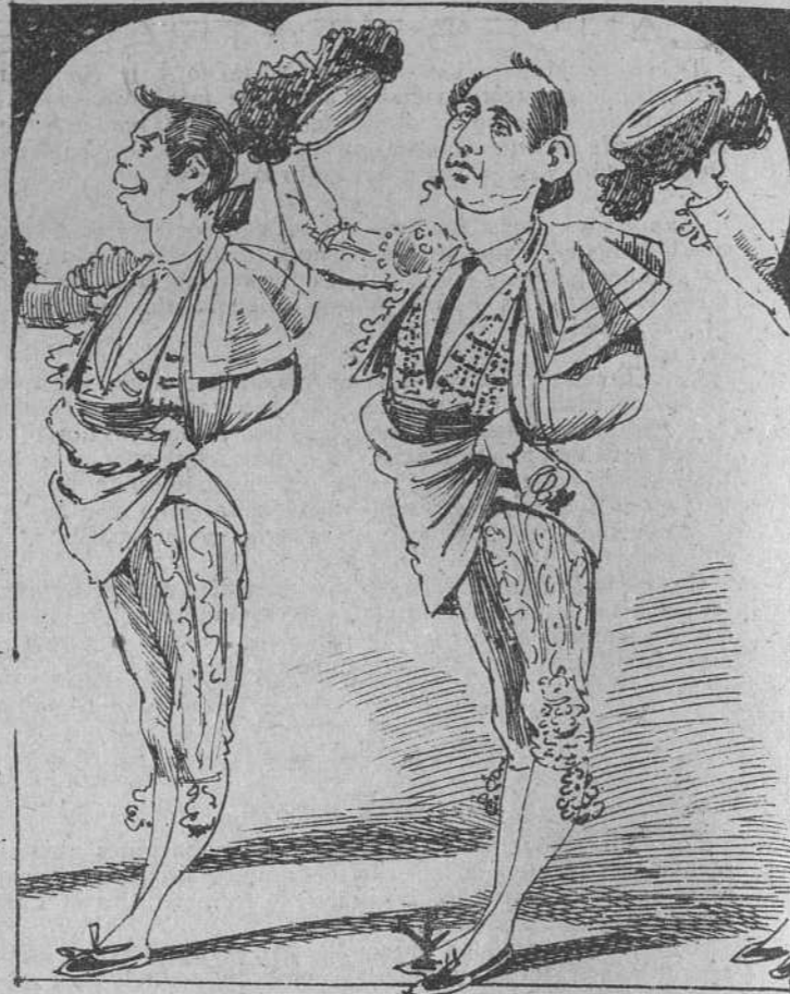
2. Eran en la tal corrida, representantes del arte en que se expone la vida, los niños... de cualquier parte;