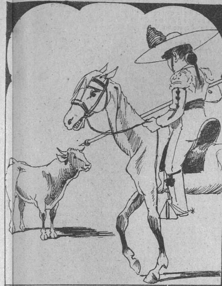
3. demostrando que la fiesta iba dando el paso atrás, pues quien con niños se acuesta... ya se sabe lo demás: