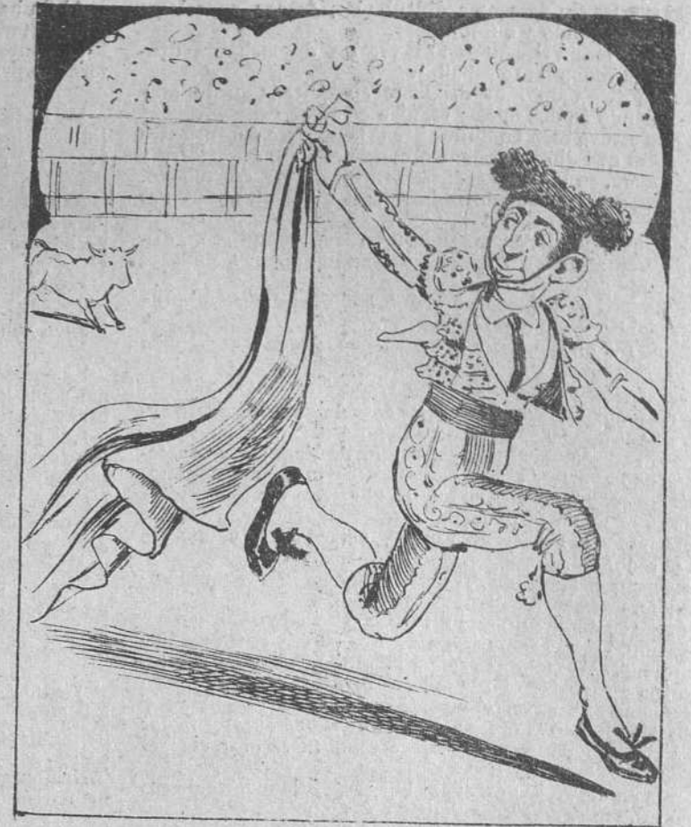
4. pero al seguir la corriente resultaban los chavales una cuadrilla eminente lidiando... á saltos mortales.