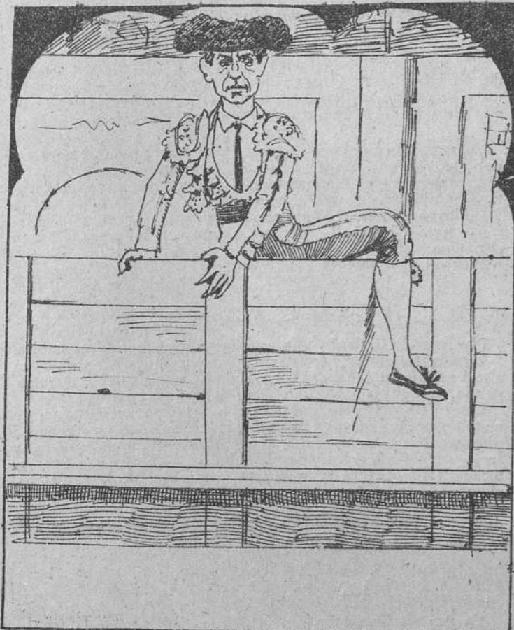
5. Viendo el viejo Salvador *an acrobática escena y llevado de su ardor, se lanzó al punto en la arena.