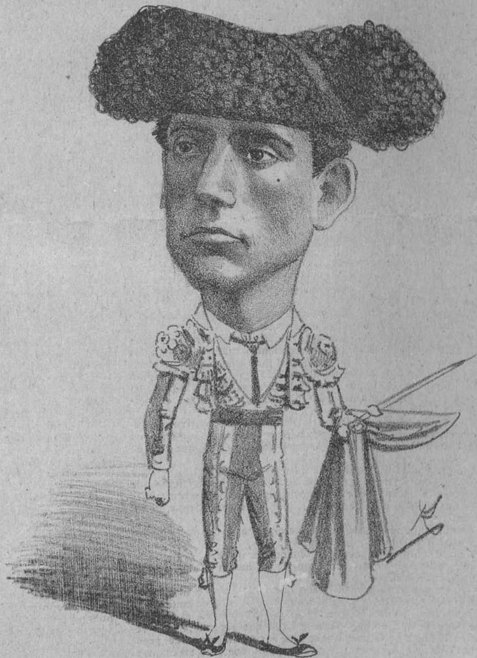
Figura en la gente nueva que ha de salvar la afición, y los que han visto la prueba mantienen esta opinión.

Yo me limito á exclamar por el momento:—¡Veremos! que si logra despuntar más adelante hablaremos.