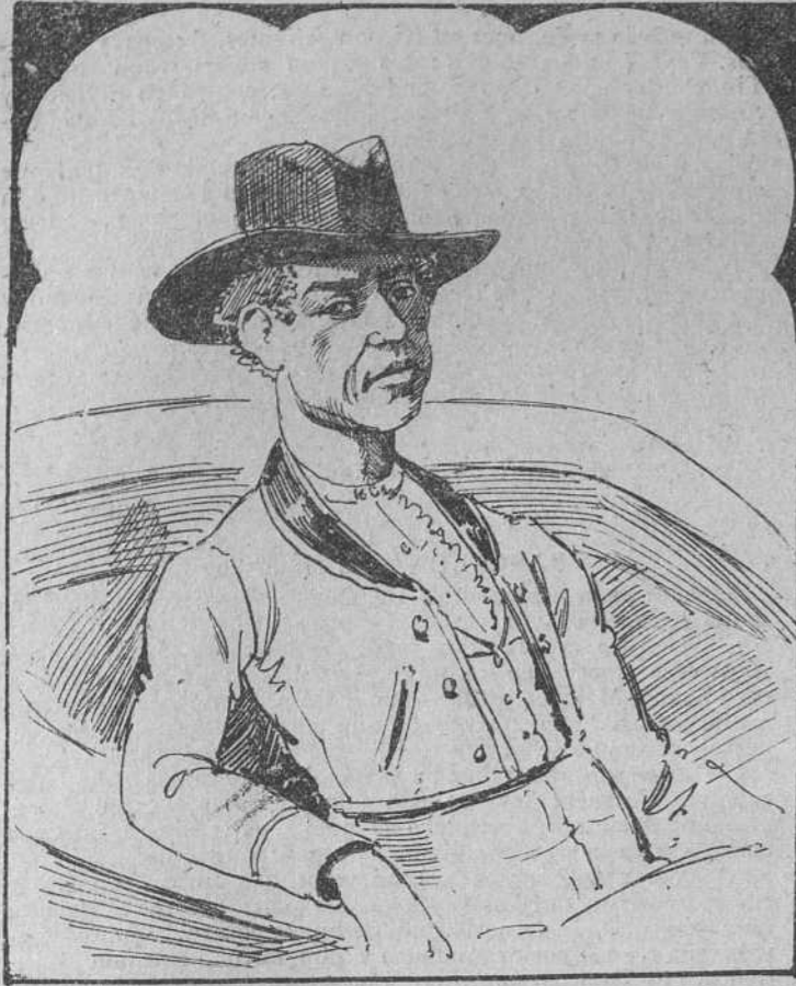
1. Conservando la afición después de cortarse el pelo, acudió en una ocasión á ver los toros, Frascuelo.