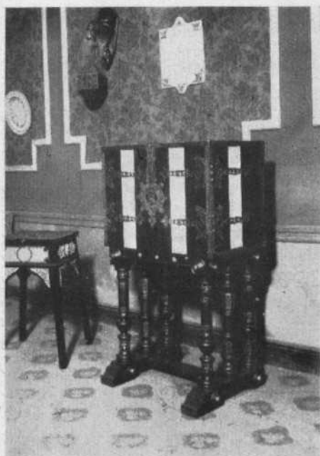
Objetos exhibidos en la Exposición de Artes Decorativas

Para terminar, cumplimos el deber — gratísimo para todos los dirigentes del Centro — de dejar constancia de nuestra gratitud para los maestros de la Escuela que han desarrollado una labor cultural notable, con una dedicación y entusiasmo dignos de loa. Son ellos: