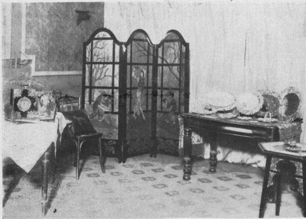
Detalle de la Exposición de Artes Decorativas

Antes de darse comienzo al interesante baile que siguió a la parte artística, el notable actor leonés señor