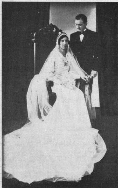
Enlace Juliá - Ordóñez

Criado, quien dedica al efecto todos los días hábiles, menos los sábados, de 10 a 11 horas en su estudio: Maipú 71, tercer piso. No se exige otro requisito que la exhibición del carnet y recibo del mes corriente o inmediato anterior.