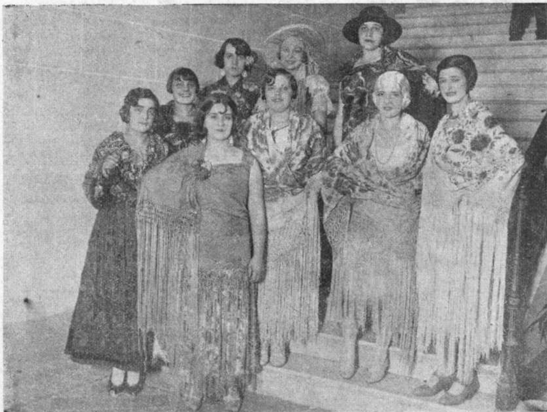
VAYA UN GRUPO DE MANTONES... Y DE CHICAS

Dieron muestras de gran actividad durante los bailes la mayoría de los miem-