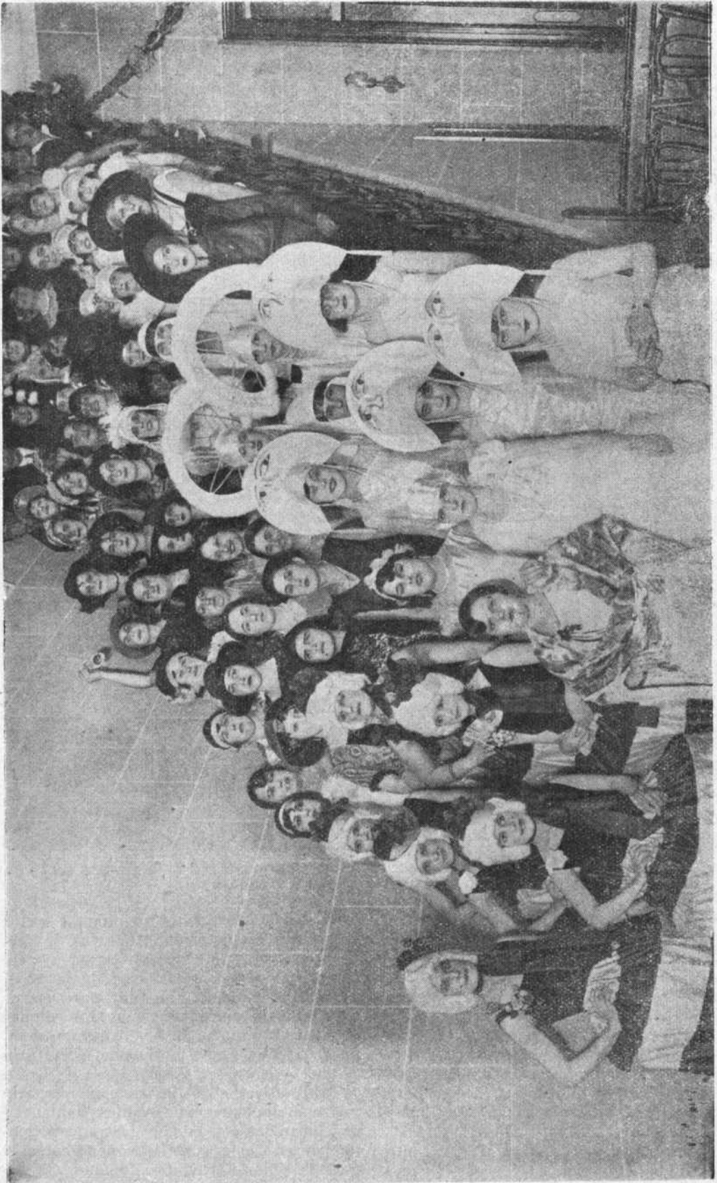
DELICIOSO CONJUNTO DE GENTILES MÁSCARAS