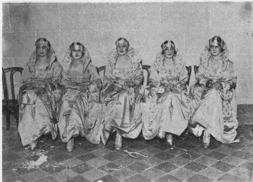
CONJUNTO "MARÍA DE MEDICIS", AL QUE SE ADJUDICÓ EL PREMIO "CENTRO REGIÓN LEONESA"

infantil, que dió motivo para que se reuniera un núcleo de familias de nuestra colectividad, bien acompañado por infinidad de niños.