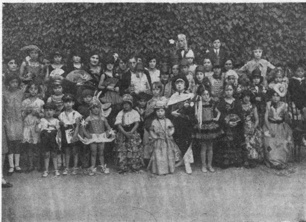
UNA PARTE DE LAS MASCARITAS QUE ACUDIERON A NUESTRO CONCURSO INFANTIL