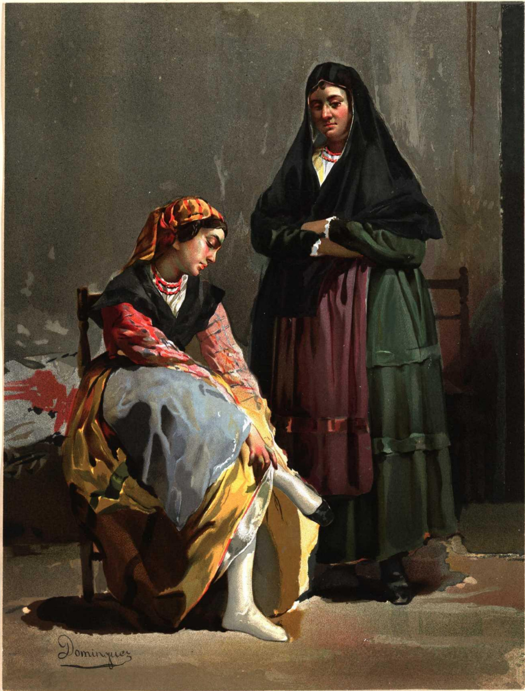
PROVA DE SEGOVIA.