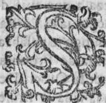
TABLA DE LOS Sermones que se contienen en este tomo.