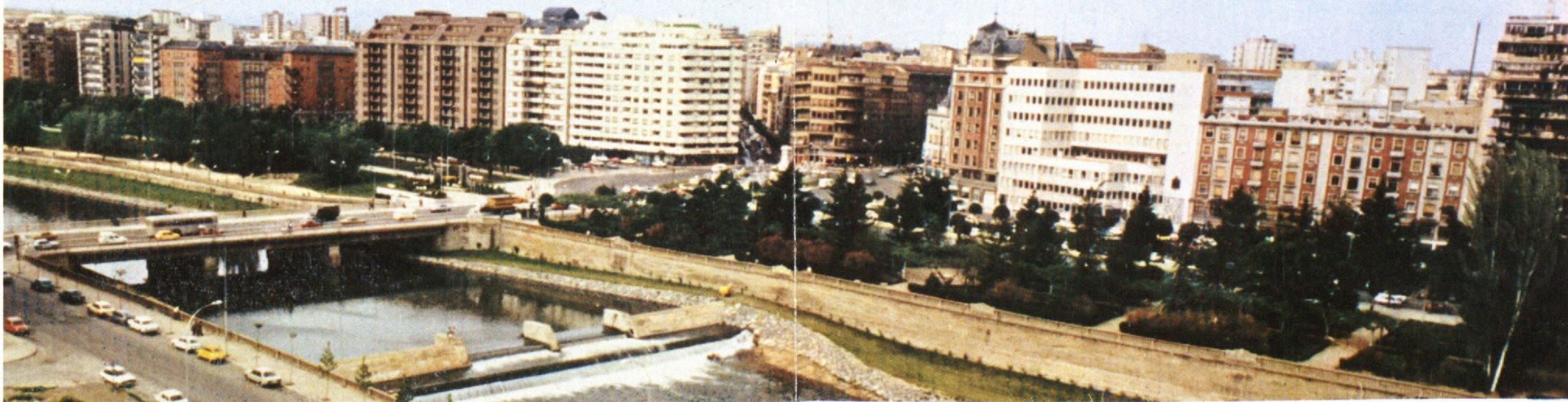
Perspectiva de la ciudad con vista parcial del encauzamiento del Bernesga.

de Títeres y Marionetas de MAESE COSMAN, los famosos payasos Familia CHOLIN, LOS MOSQUERROS y el MALVADO CARDENAL.