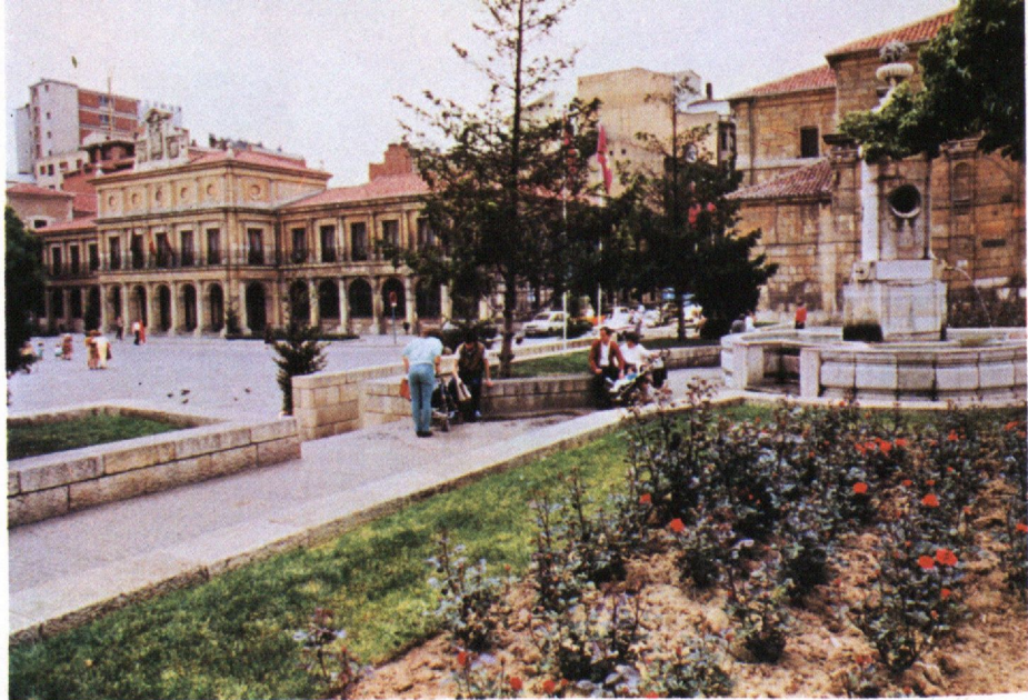
Parcial de la Plaza de San Marcelo, con el Ayuntamiento al fondo.

Nuestras Fiestas Grandes nos renuevan su tradicional demanda de atención porque no sólo, otra vez, tenemos que organizarlas sino que estamos gustosamente obligados a ello.