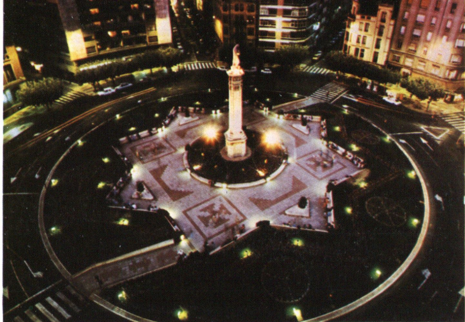
Aérea nocturna de la Plaza de Calvo Sotelo.