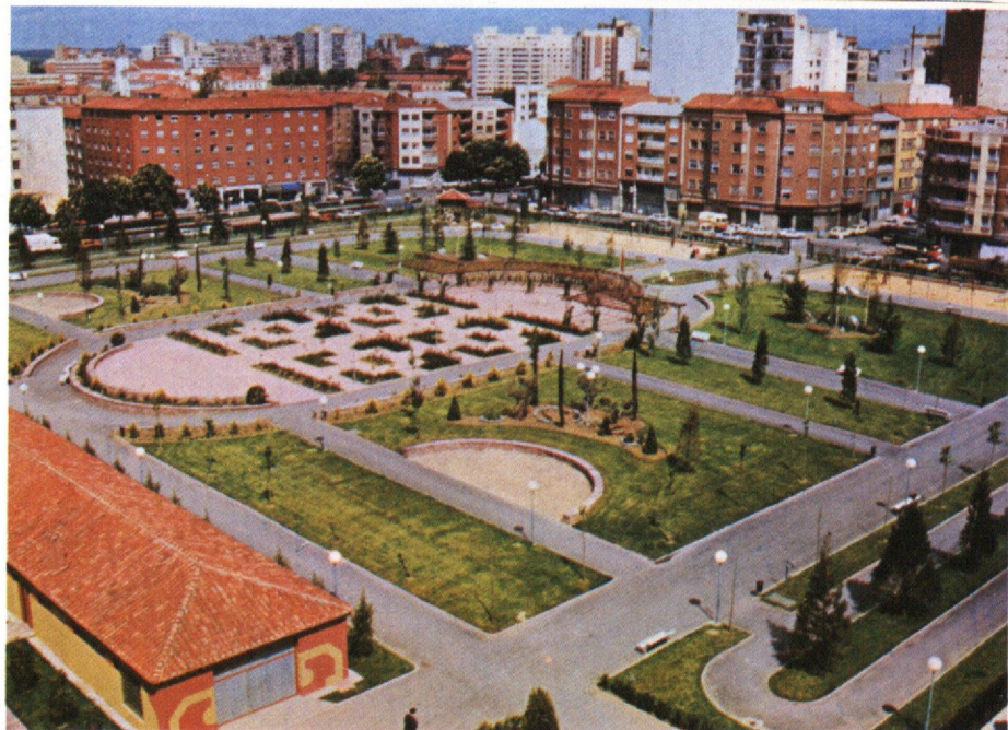
Panorámica del nuevo Parque de los Reyes de España en la Avda. de José Aguado.