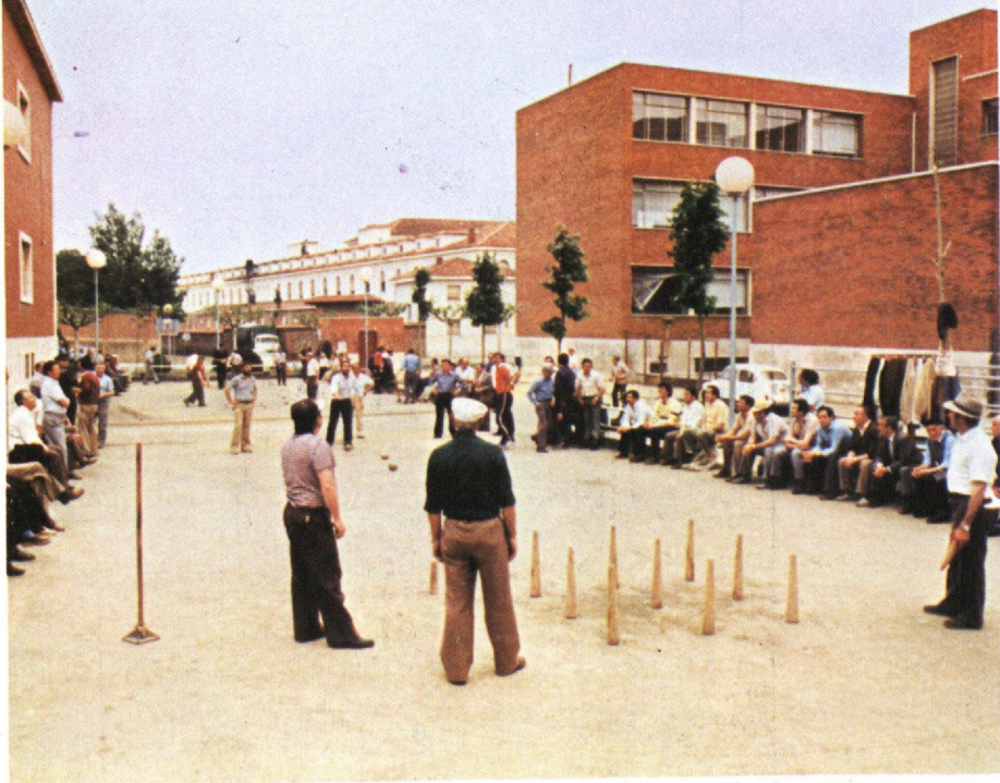
En la Bolera de San Francisco.

Organizada por el Club Náutico de Vigo, en las Piscinas Municipales.