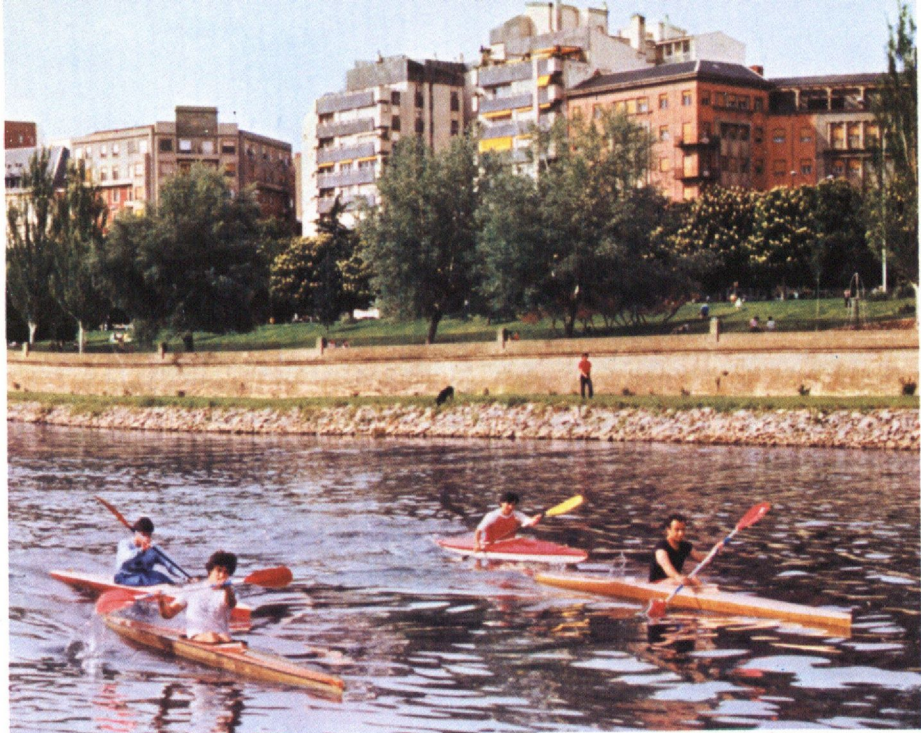
Piragüistas en el Bernesga.

11,30 horas: II Gran Premio Nacional de Piragüismo "Ciudad de León", en el río Bernesga.