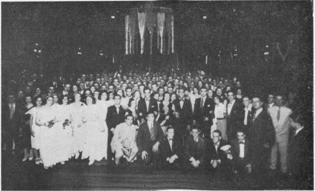
Aspecto de nuestro Salón de Fiestas, durante uno de los bailes de Carnaval.