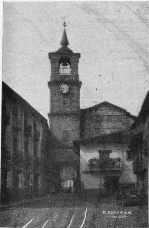
“Arco del Reloj” — Ponferrada (León)