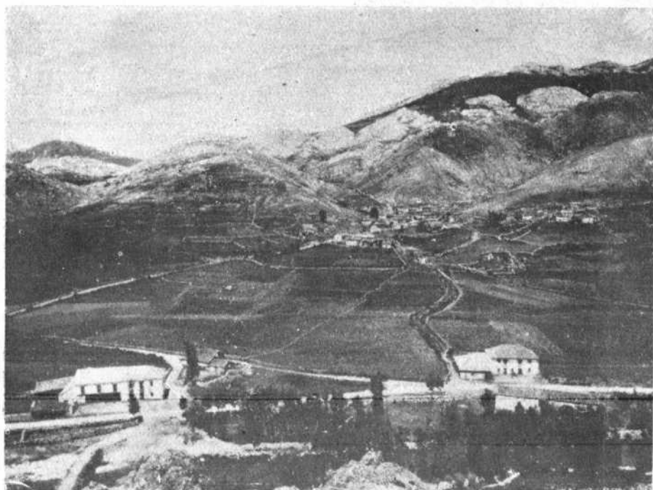
VISTA PANORÁMICA DE VILLAFELIX (LEÓN)

Organo oficial de la Asociación CENTRO REGIÓN LEONESA