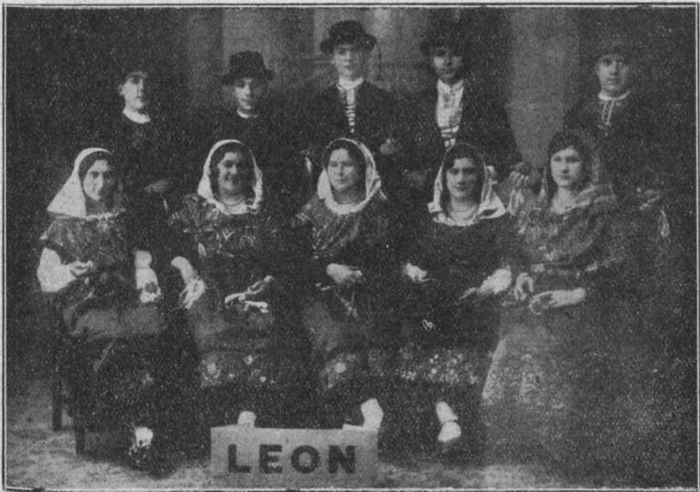
CONJUNTO LEONÉS ATAVIADO CON LAS GALAS MARAGATAS

El conjunto leonés, compuesto por los entusiastas consocios que indica la fotografía, se presentó ataviado con el típico y vistoso traje Maragato, llamando justamente la atención general por su entusiasmo y corrección en el desempeño del número de bailes que les correspondió.