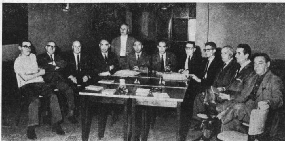
Integrantes de la C. D. que visitaron al Hospital Español