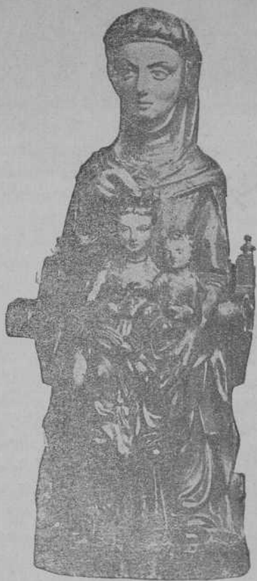
Parece escultura original del siglo XIV; pintura segunda mitad del XVI