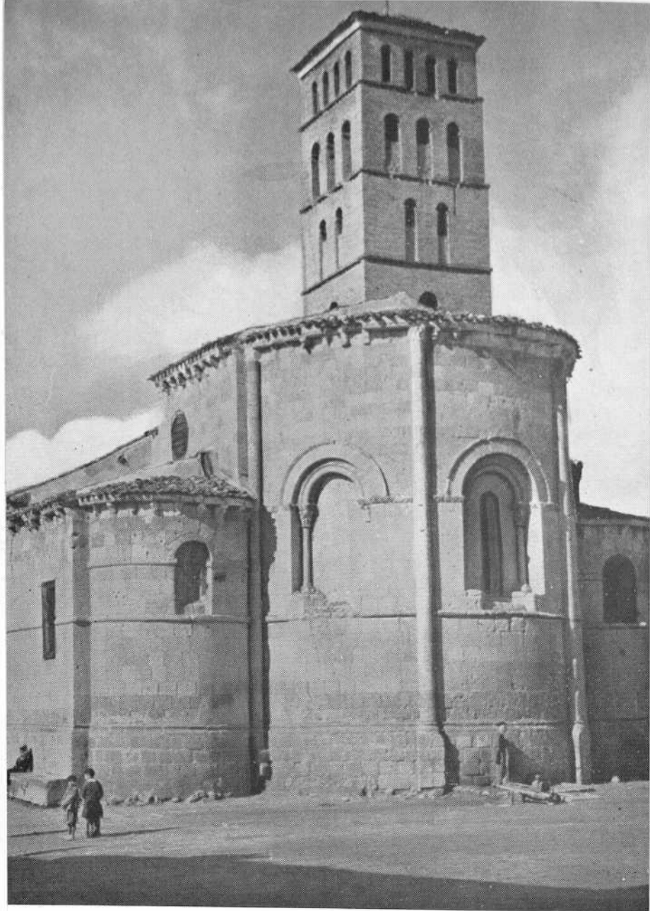
Absides y torre de la vieja iglesia románica de San Lorenzo