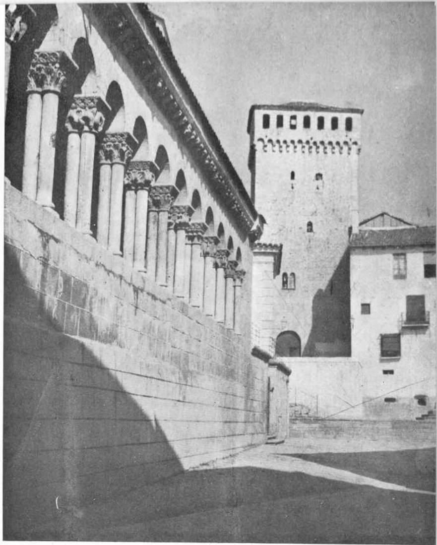
Atrio de la iglesia de San Martín y torre fuerte de los Lozoya