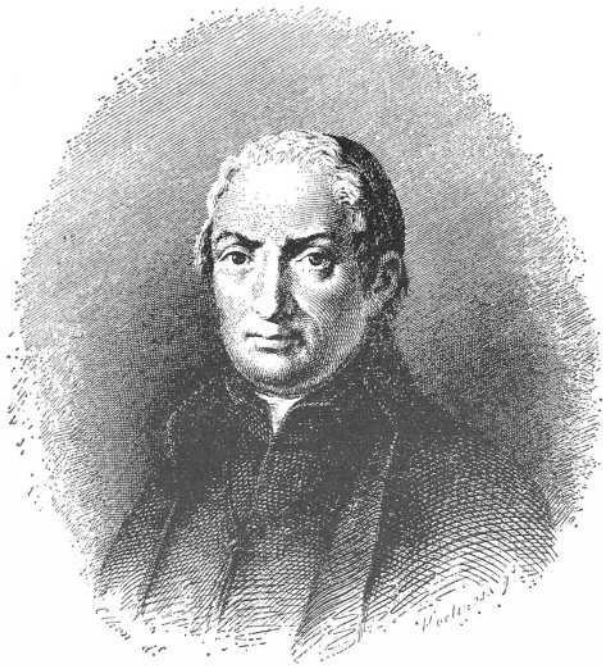
EL P. J. F. DE ISLA