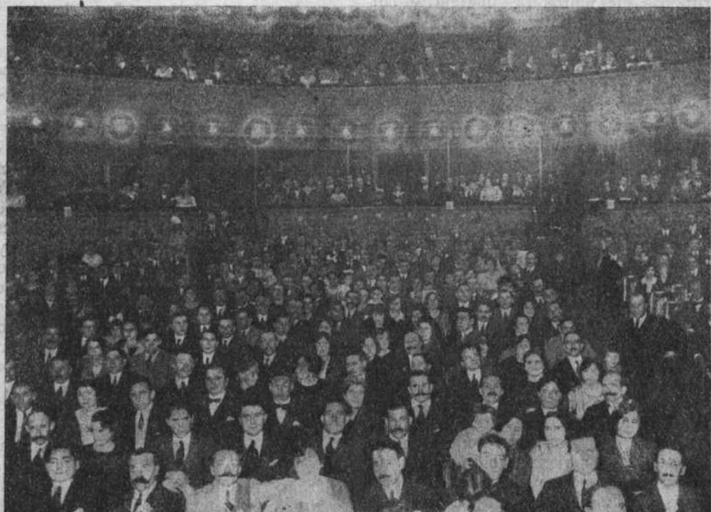
LA SALA DEL TEATRO VICTORIA DURANTE LA REPRESENTACIÓN.