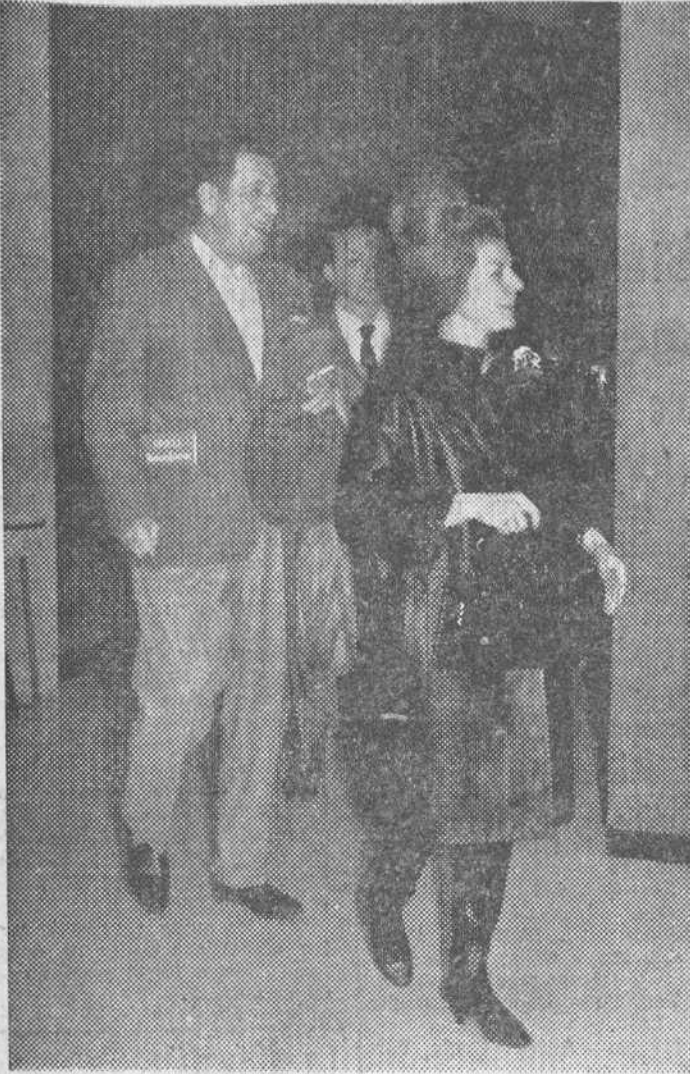
Torremolinos (Málaga).—El ex-presidente de la Argentina, don Juan Domingo Perón y su esposa, saliendo del Hotel Riviera, momentos antes de partir para Madrid.