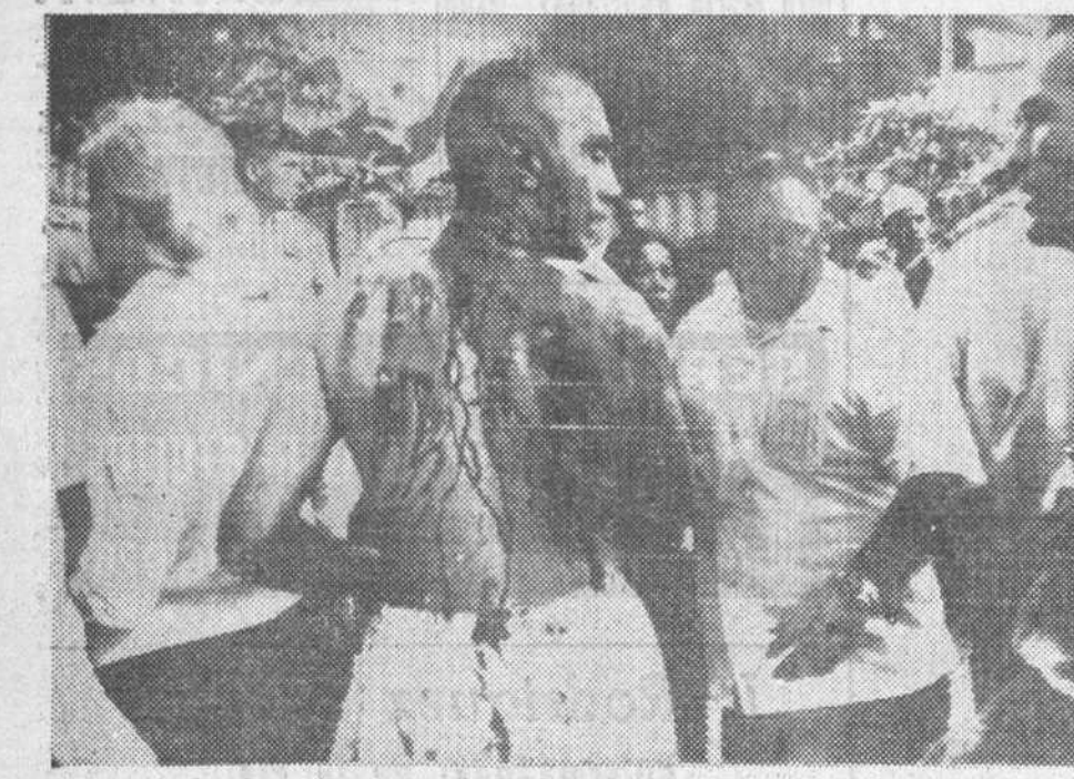
Saigón. Terroristas vietnamitas han arrojado la más poderosa bomba de la guerra en el Vietnam sobre unas barracas de oficiales norteamericanos. Murieron dos de éstos y 107 resultaron heridos. En la foto vemos a uno de los heridos después del atentado.