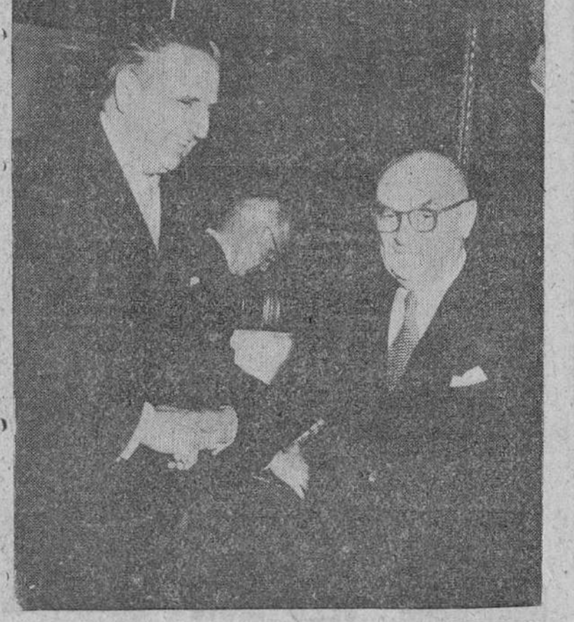
Ankara.—El Sr. Martín Artajo saluda al presidente Bayar, con motivo de la entrevista celebrada en la residencia presidencial de Cankaya.